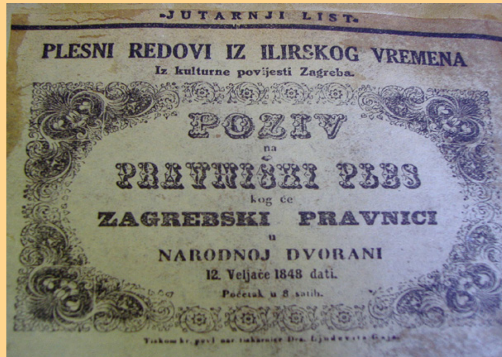
Poziv na pravnički ples u Narodnoj dvorani (danas Preporodna dvorana Palače Narodnog doma Hrvatske akademije znanosti i umjetnosti). Dvorana je otvorena plesom 8. veljače 1847. godine. Prema izvještaju u Danici , prisustvovalo mu je 800 osoba. Zabilježeno je i da Dvorana zajedno s prostranim galerijama „može lahko do 1000 osobah primiti“. Prema današnjim koncertnim standardima u dvorani i na galeriji ima 220 mjesta.