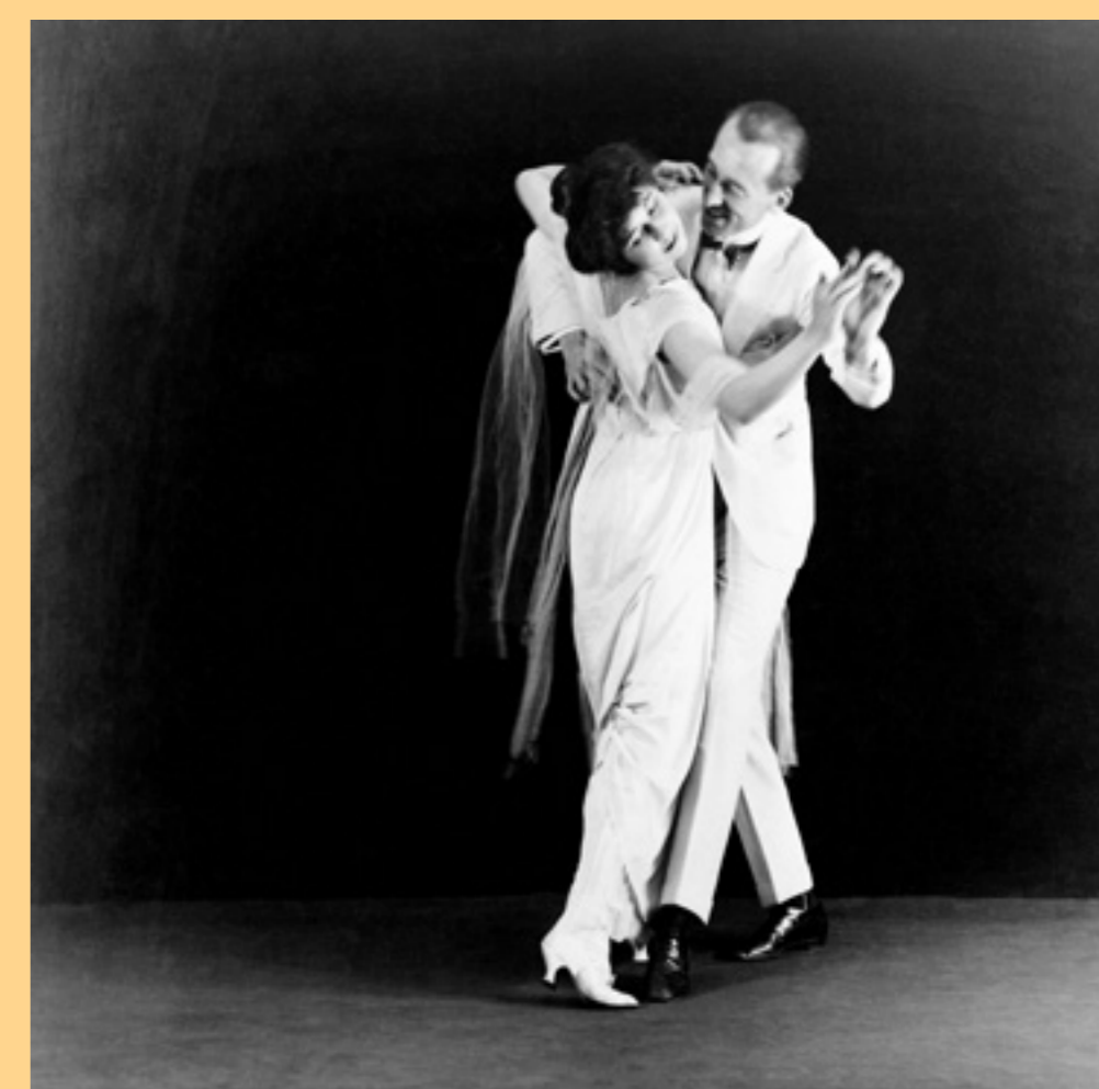
Slavni plesački par Vernon i Irene Castle, oko 1912.

Fotografije iz ostavštine obitelji Eisenhuth, pohranjene u Hrvatskom glazbenom zavodu u Zagrebu. Nastale su 1930-ih u atelieru Foto Tonka Antonije Kulčar, koja je ostavila veliki trag u dokumentiranju društvenog i kulturnog života Zagreba tijekom međuratnog razdoblja.