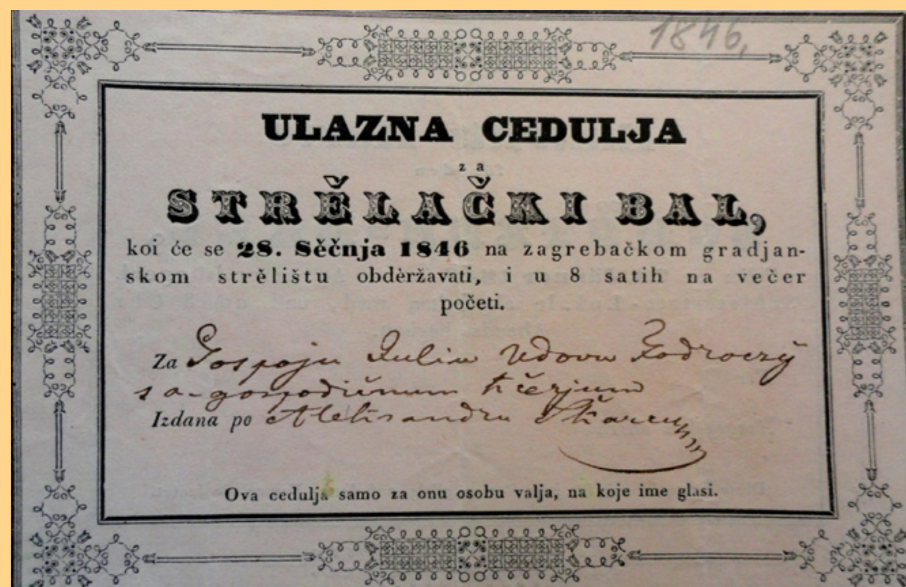
Ulazna cedulja za „strelački bal“ u Građanskoj streljani na zagrebačkom Tuškancu (danas kino Tuškanac). Sredinom 19. stoljeća Streljana je bila poznata kao jedno od središta zagrebačkoga društvenog života. Osim koncerata, tamo su se održavali plesovi i zabave. Pietro Coronelli , hrvatski baletni plesač talijanskog podrijetla, u Streljani je 1860. otvorio plesnu školu.

Primjer povezanosti plesa i aleatorike: bacanjem kocke određivao bi se redoslijed glazbe na koju se plesao menuet. Na taj bi se način u stvaralački proces uključivali i izvođači koji bi, unutar danih mogućnosti, odabirali vlastita rješenja.