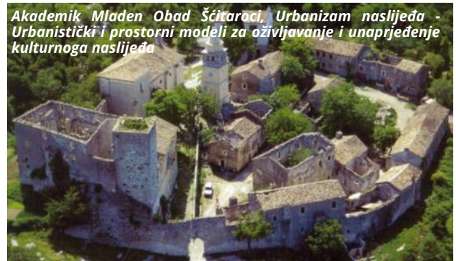
Akademik Mladen Obad Šćitaroci, Urbanizam naslijeđa - Urbanistički i prostorni modeli za oživljavanje i unaprjeđenje kulturnoga naslijeđa

Prvi kolokvij održao je akademik Mladen Obad Šćitaroci na temu "Unaprjeđenje kulturnog naslijeđa u kontekstu urbanizma naslijeđa". Istaknuo je kako Hrvatska baštini 25 stoljeća urbane kulture, a svega mali dio kulturnoga naslijeđa zbrinut je i očuvan za buduće naraštaje, stoga u sklopu znanstvenog projekta „Urbanizam naslijeđa - Urbanistički i prostorni modeli za oživljavanje i unaprjeđenje kulturnoga naslijeđa“ (Heritage Urbanism – HERU) želi odgovoriti na pitanje koji su učinkoviti modeli koji će zaustaviti nestajanje naslijeđa, pomoći u njegovu oživljavanju i unaprjeđenju te omogućiti opstanak i život naslijeđa. Drugi kolokvij održao je izv. prof. dr. sc. Mile Šikić, voditelj uspostavnog istraživačkog projekta „Algoritmi za analizu slijeda genoma“, na temu