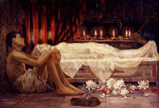
Bela Čikoš Sesija, Mrtva straža