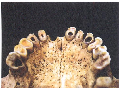
Slika 3. Jaka istrošenost griznih ploština na zubima

Zanimljivo je istaknuti da su istraživači uočili da tijekom razdoblja između 1400 i 1700 godine dolazi do značajne promjene u ishrani. Ta se promjena reflektira u različitim učestalostima dentalnih oboljenja u razdobljima prije i za vrijeme endemskog ratovanja. Na temelju trenutno dostupnih podataka čini se kako ljudi u razdoblju endemskog ratovanja prelaze na eksploataciju usjeva koji zahtijevaju manje investicija i vremena za obradu (moguće zbog opasnosti od čestih neprijateljskih upada) te je u tom kontekstu moguća promjena s kultivacije pšenice u razdoblju prije endemskog ratovanja na kultivaciju prosa koji je puno otpornija biljka i zahtjeva znatno manje obrade u razdoblju endemskog ratovanja.