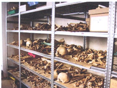
Slika 2. Laboratorij

Na uzorku od 706 analiziranih kostura (295 iz razdoblja prije endemskog ratovanja i 411 iz tog razdoblja) pokazalo se da se učestalost trauma kod muškarca povećava tijekom endemskog ratovanja s 18,5% na 25,9%, dok učestalost trauma kod žena raste s 7,4% na 21,1%, dakle gotovo tri puta više. Moguće je da su žene namjerno birane za mete napada (možda zbog šok efekta koje to ima u slučajevima kada je svrha napada bila etničko čišćenje nekog područja). Moguće je međutim i da se radi o kombinaciji vanjskih (vojni upadi ili gerilsko ratovanje) i unutrašnjih (povećana učestalost obiteljskog nasilja) čimbenika. Istraživači će u daljnjem tijeku istraživanja pokušati objasniti te rezultate i ustanoviti u kojoj mjeri se podudaraju s rezultatima analiza trauma u modernim populacijama koje su izložene endemskom ratovanju.