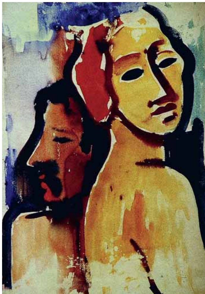
Par, 1937. akvarel, vlasništvo nepoznato, sl. 4