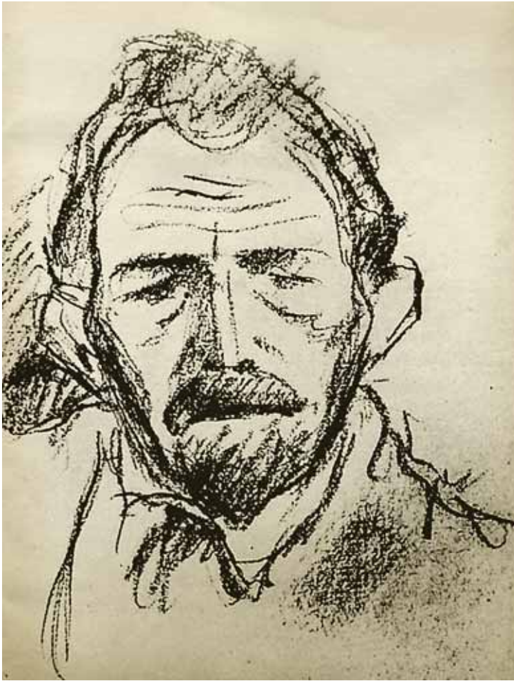
Studija za portret Hansa Blühera, 1935/36. ugljen, izgubljeno, sl. 1