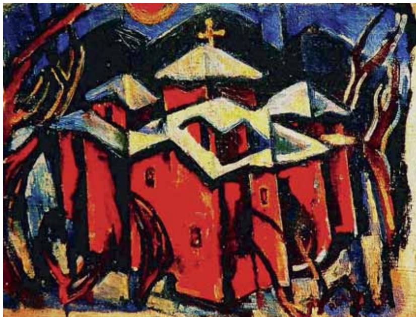
Ortodokсна crkva na mjeseci, 1939. ulje na platnu, privatno vlasništvo Zagreb, sl. 5