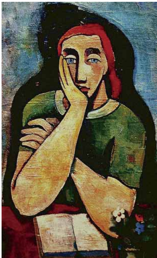
Crvenokosa žena sa knjigom, 1937. ulje na platnu, vlasništvo nepoznato, sl. 3