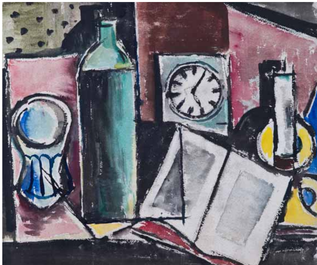
Mrtva priroda s flašom, oko 1940. akvarel, kat. br. 6