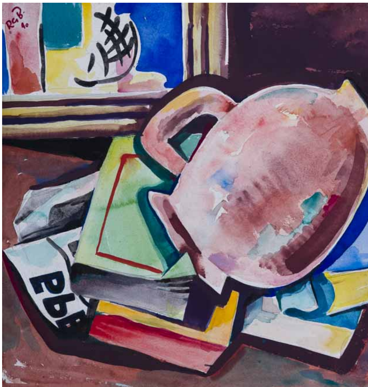
Mrtva priroda s vrčem, 1940. akvarel, kat. br. 5