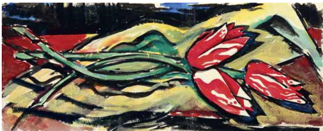
Tulipani , oko 1940. akvarel, kat. br. 7 verso, detalj na str. 30