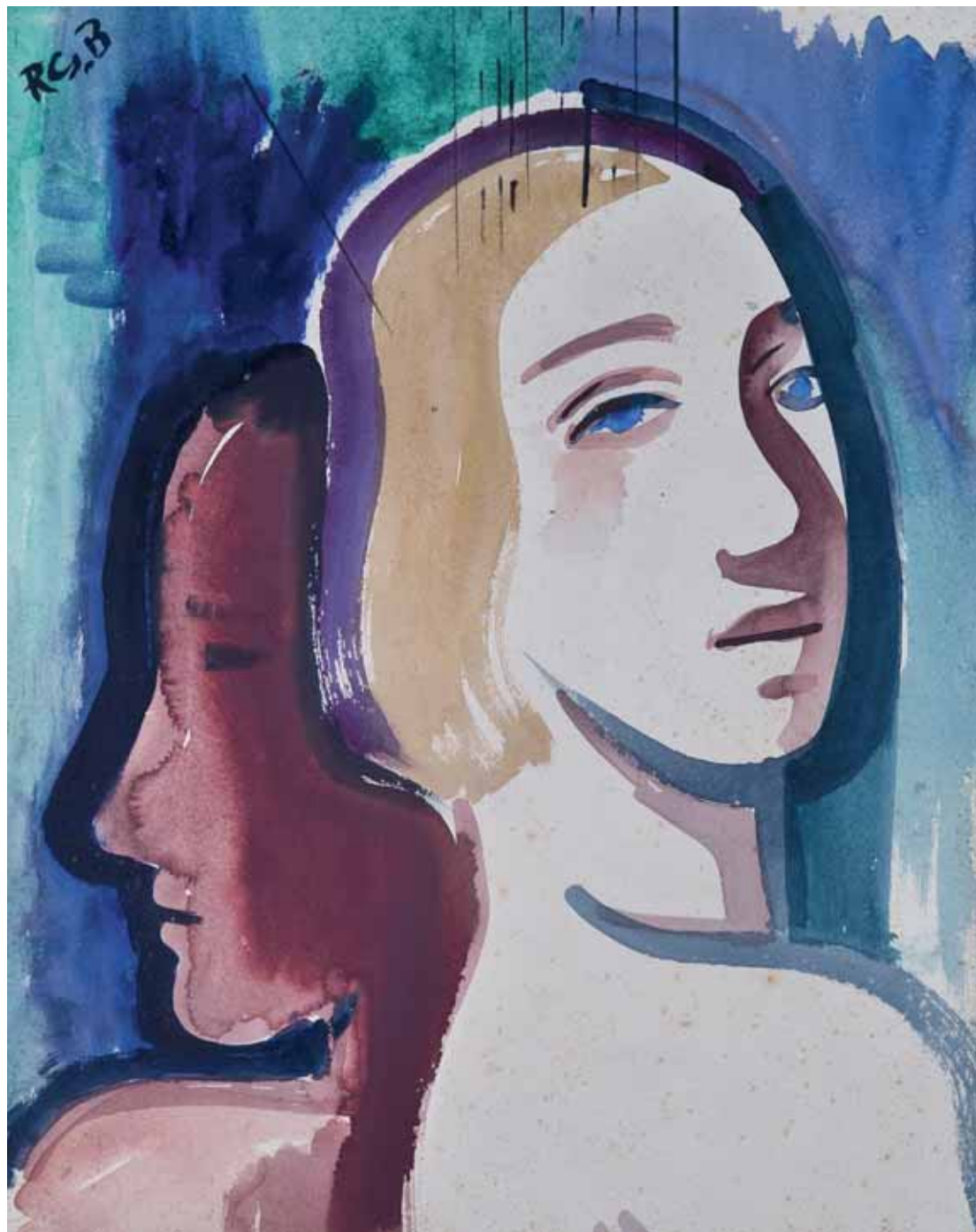
Par, 1937. akvarel, kat. br. 3