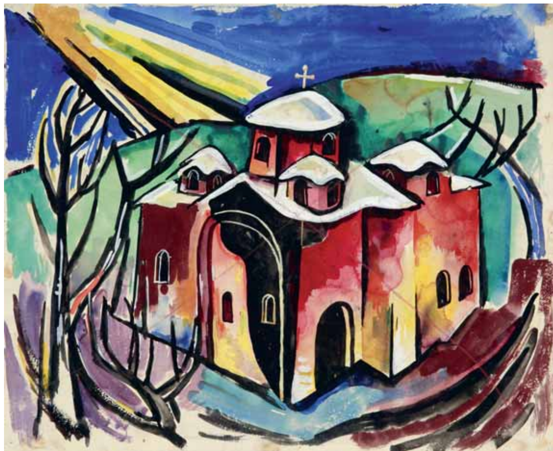
Ortodoksna crkva na mjesecini, 1939. akvarel, kat. br. 4 verso