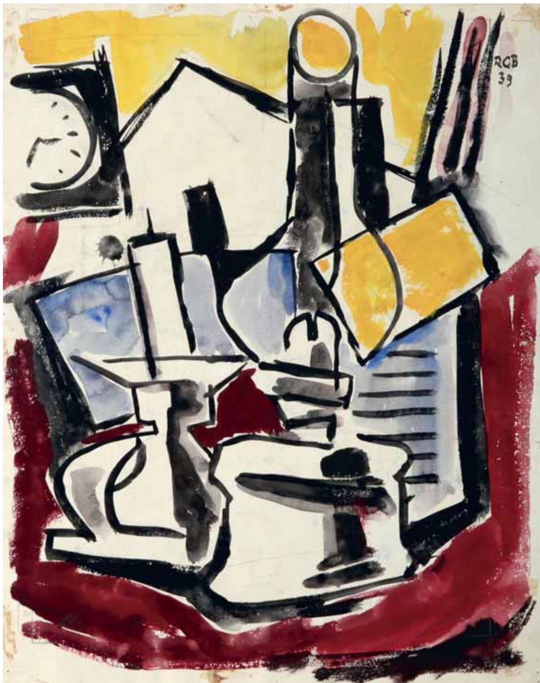
Mrtva priroda s petrolejskom lampom, 1939. akvarel, kat. br. 4