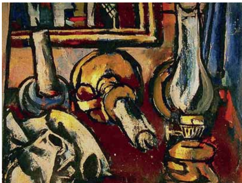
Mrtva priroda s petrolejskom lampom, 1940. ulje na platnu, privatno vlasništvo Split, sl. 7