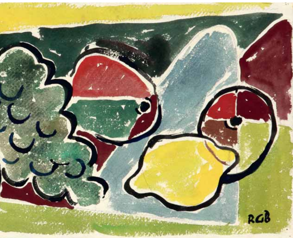
Voće, oko 1940. akvarel, kat. br. 7