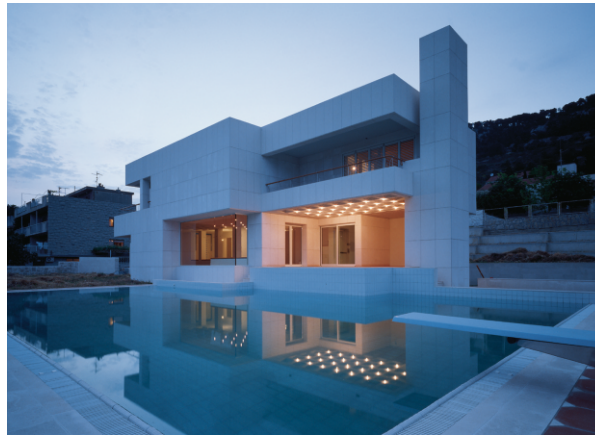
obiteljska kuća stupalo meje split / 2000 družinska hiša stupalo meje split / 2000