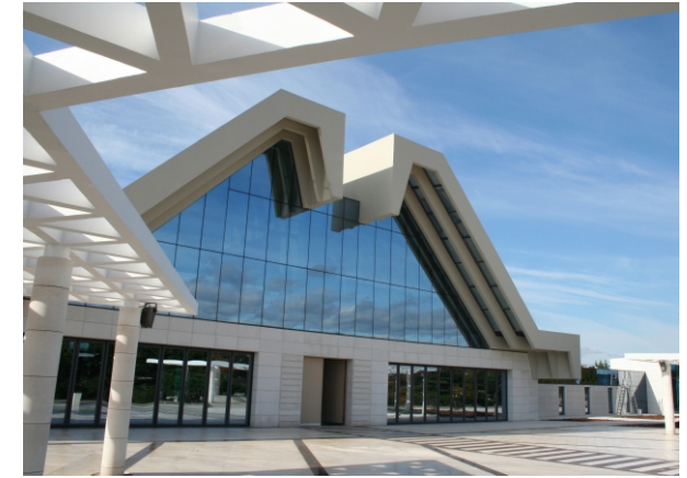
ceremonijalni prostor groblje drenova rijeka / 2007 ceremonijalni prostor pokopališće drenova rijeka / 2007