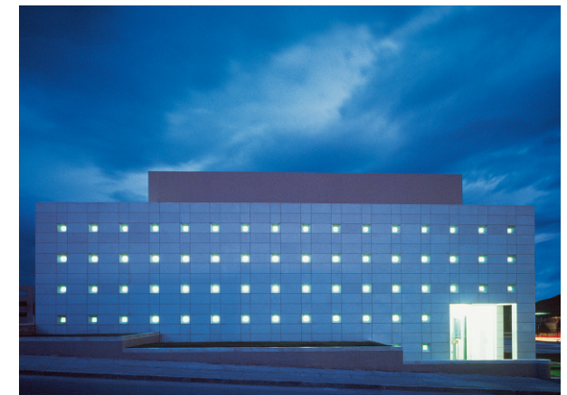
komercijalni distribucijski centar tvornice duhana rovinj u splitu / 2001 komercijalni distribucijski centar tobačna tovarena rovinj u splitu / 2001