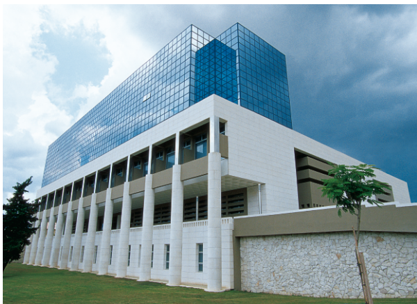
ekonomski fakultet sveučilišni kampus split / 2001 ekonomska fakulteta univerzitetni kampus split / 2001