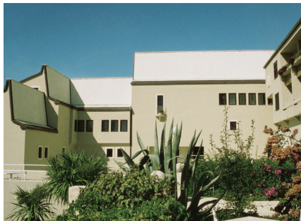
hotel bretanide bol brač / 1986 hotel bretanide bol brač / 1986