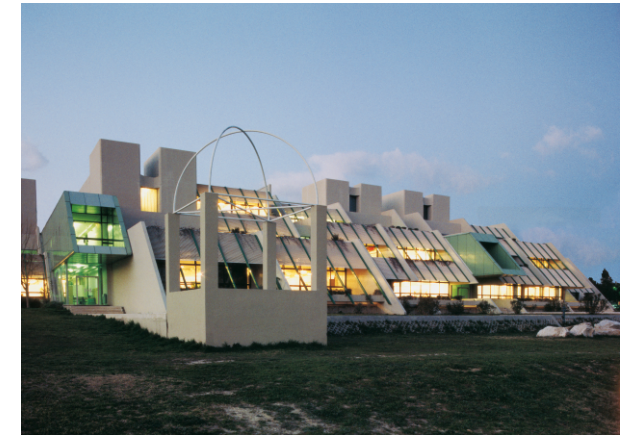
srednjoškolski centar split / 1992 srednja šola split / 1992