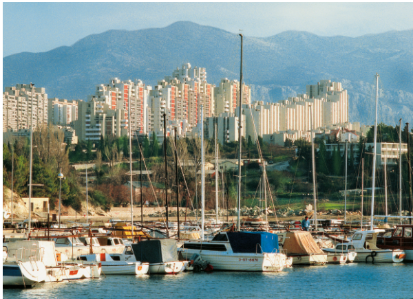
stambena ulica braće borozan split 3 / 1973 (koautor m.zorić) stanovnijska ulica bratov borozan split 3 / 1973 (soavtor m.zorić)