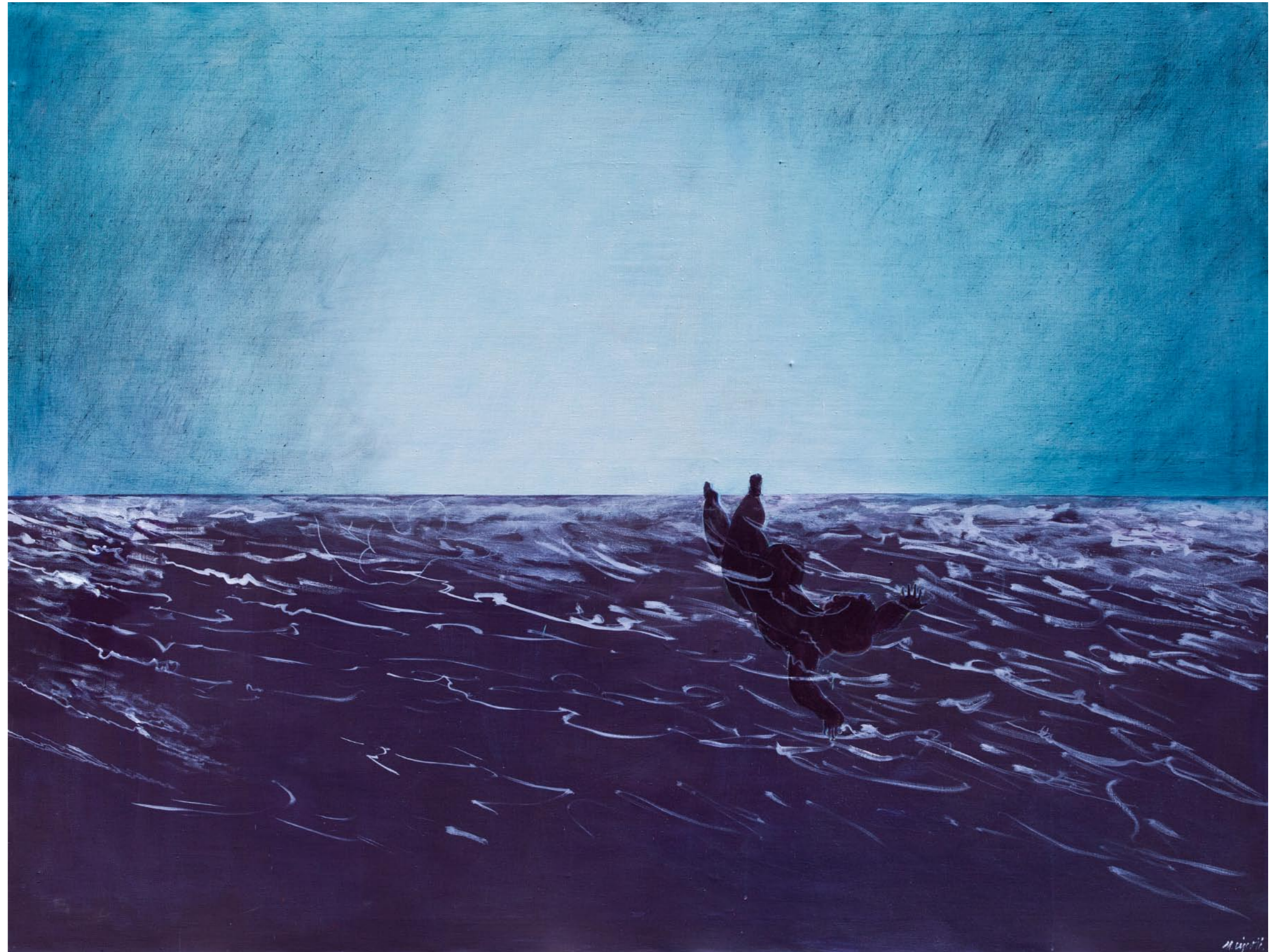
>> Pevsner, 2005. akril na platnu / acrylic on canvas 200 x 150 cm