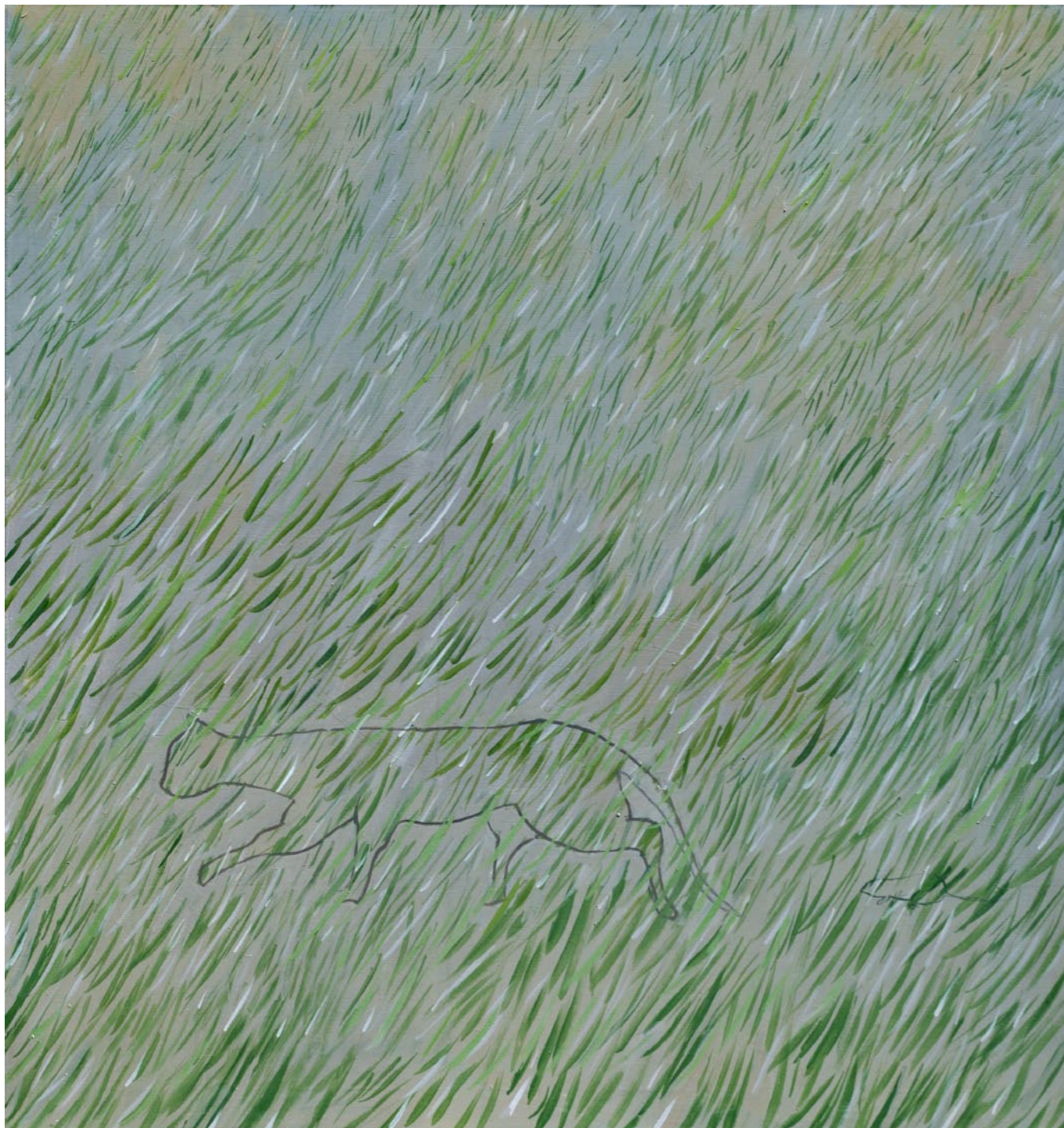
Mačka i miš / Cat and Mouse, 2012. akril na platnu / acrylic on canvas 150 x 140 cm