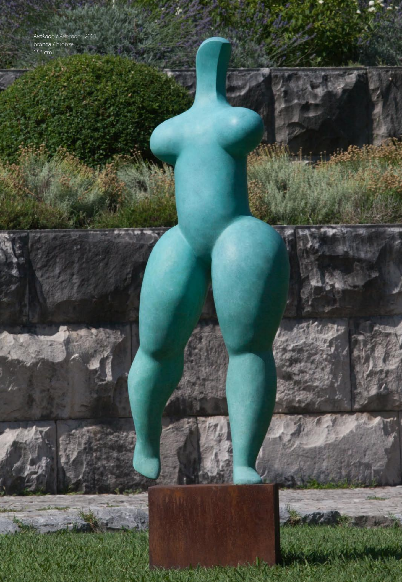
Avokado / Avocado , 2001. branca / bronze 153 cm