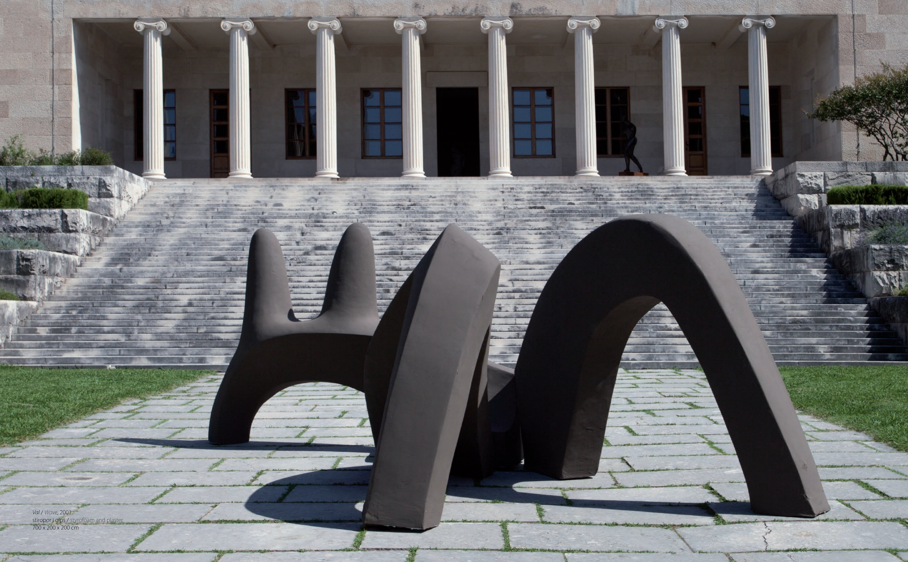
Val / Wave, 2001. stiropor i gips / styrofoam and plaster 700 x 200 x 200 cm