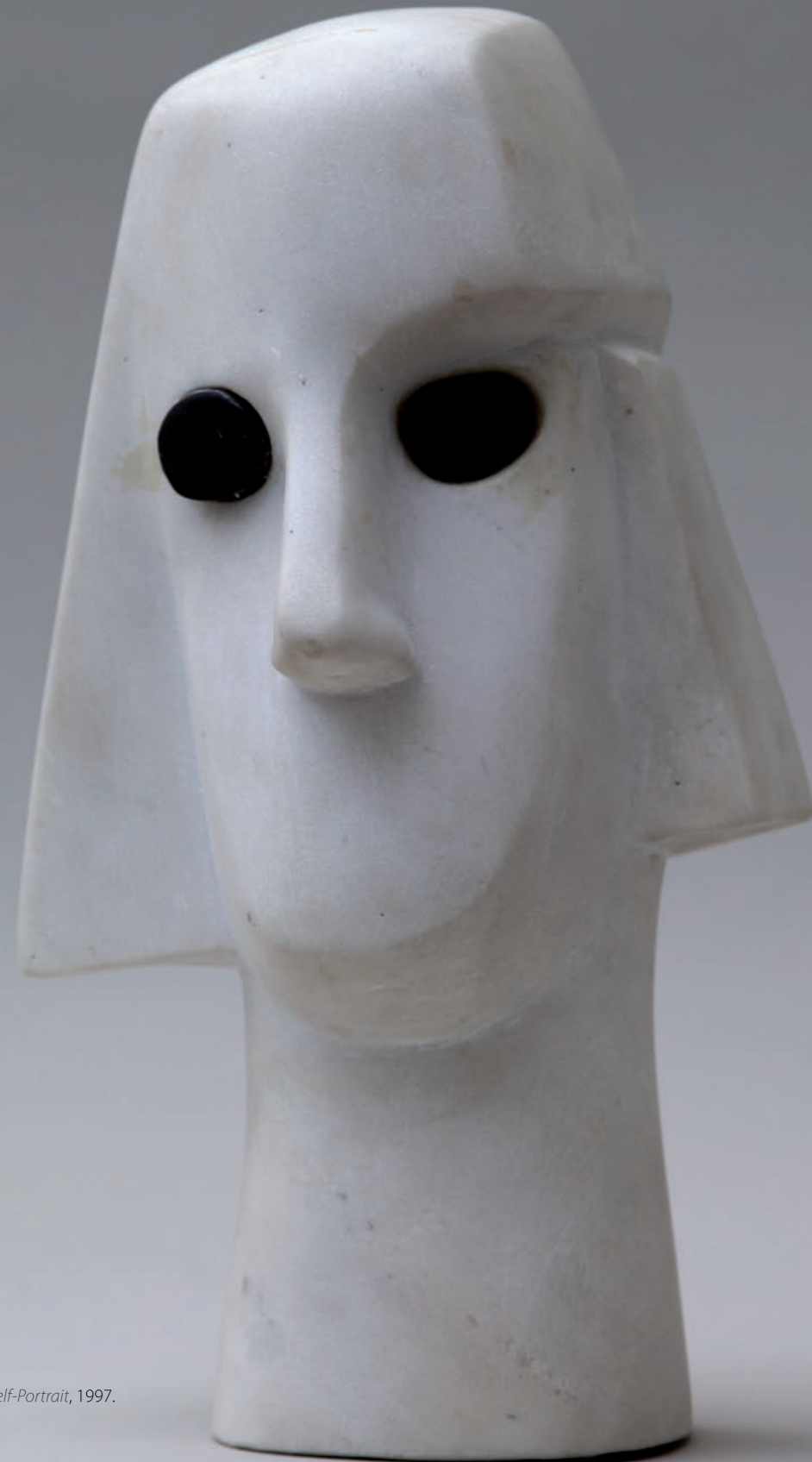
Autoportret / Self-Portrait, 1997. kamen / stone 34 cm