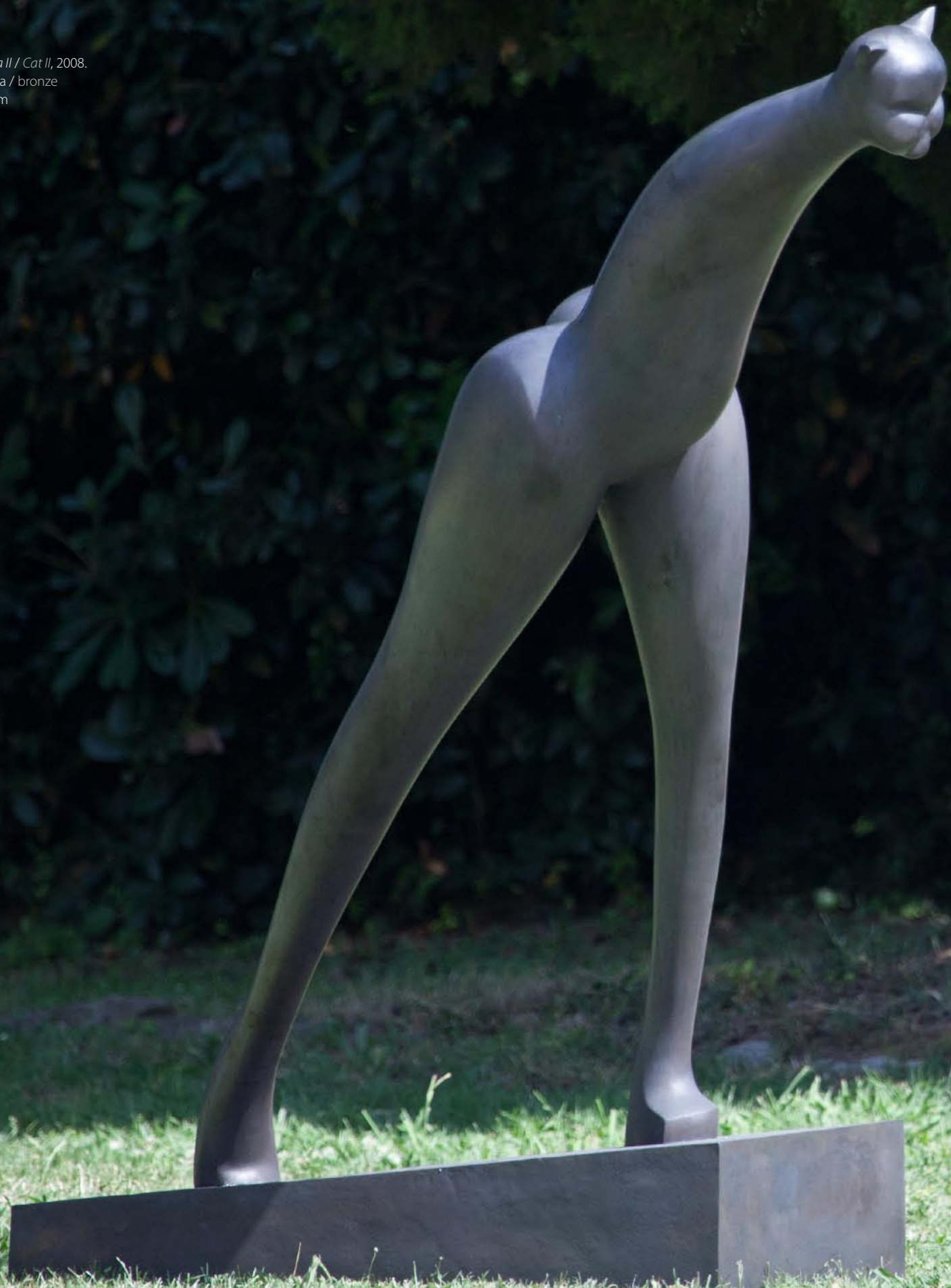
Mačka II / Cat II, 2008. bronca / bronze 141 cm