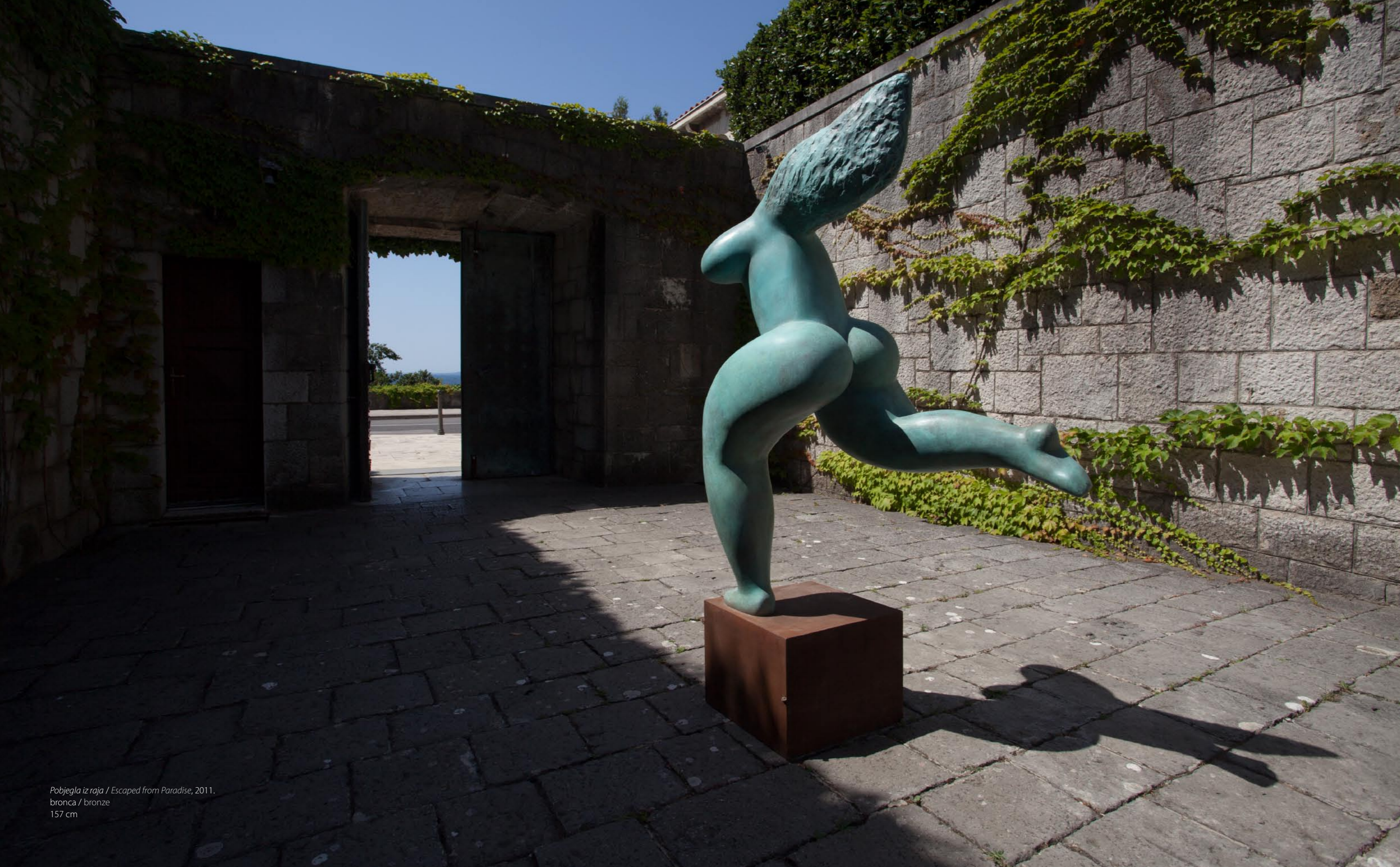
Pobjegla iz raja / Escaped from Paradise, 2011. bronca / bronze 157 cm