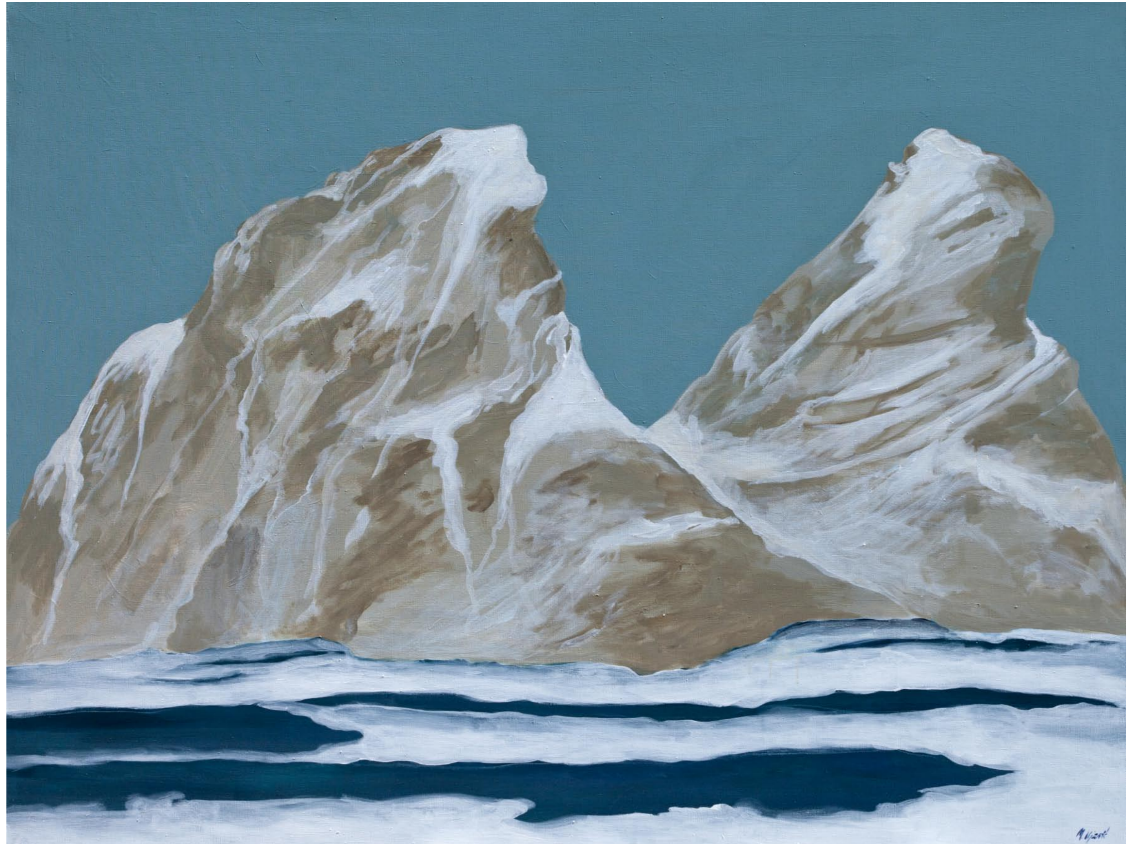
>> Pred olujom / Before Storm, 2014. akril na platnu / acrylic on canvas 200 x 150 cm