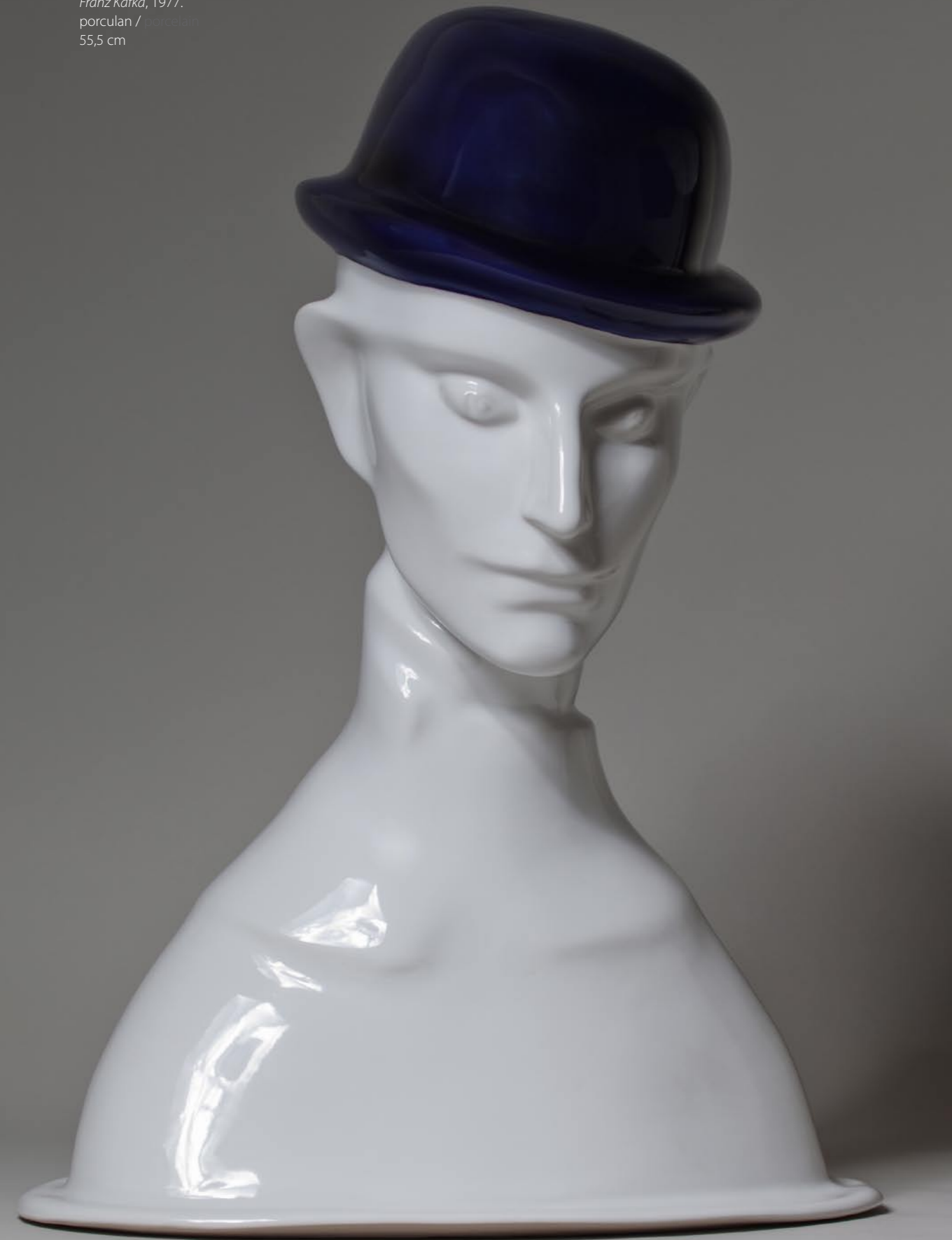
Franz Kafka, 1977. porculan / porcelain 55,5 cm