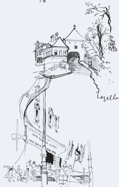
ZAGREB - KLACIĆEV TRG 15/9/12