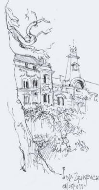
INA SKUPŠTINA 04/11/11