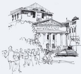
THEATRE ROYAL DE LA MONNAIS BRUXELLES 07/10/10