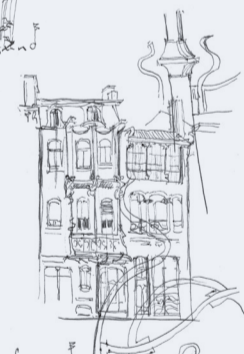
LA MAISON DE VICTOR HORTA A BRUXELLES 05/08/10