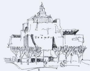
ZAGREB - VANDERBILT PAVILION - RESTAURACIJA 24/1/11