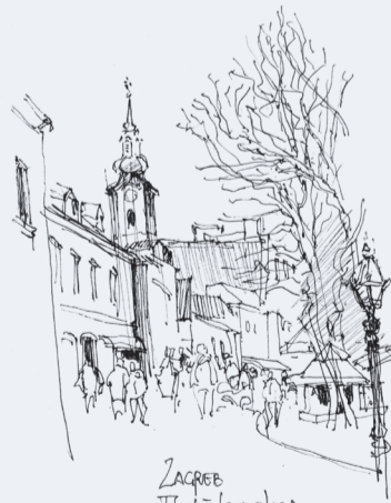
ZAGREB Trkalčeva ulica