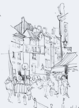
BRUXELLES 04/10/16 RUE DU MARCHÉ AUX HERBES GRASMARKT