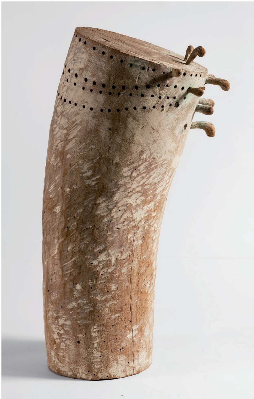
Kuzma Kovačić Marcabrunova pjesma , 1979. obojeno drvo v. 48 x d. 26,5 x 19 cm