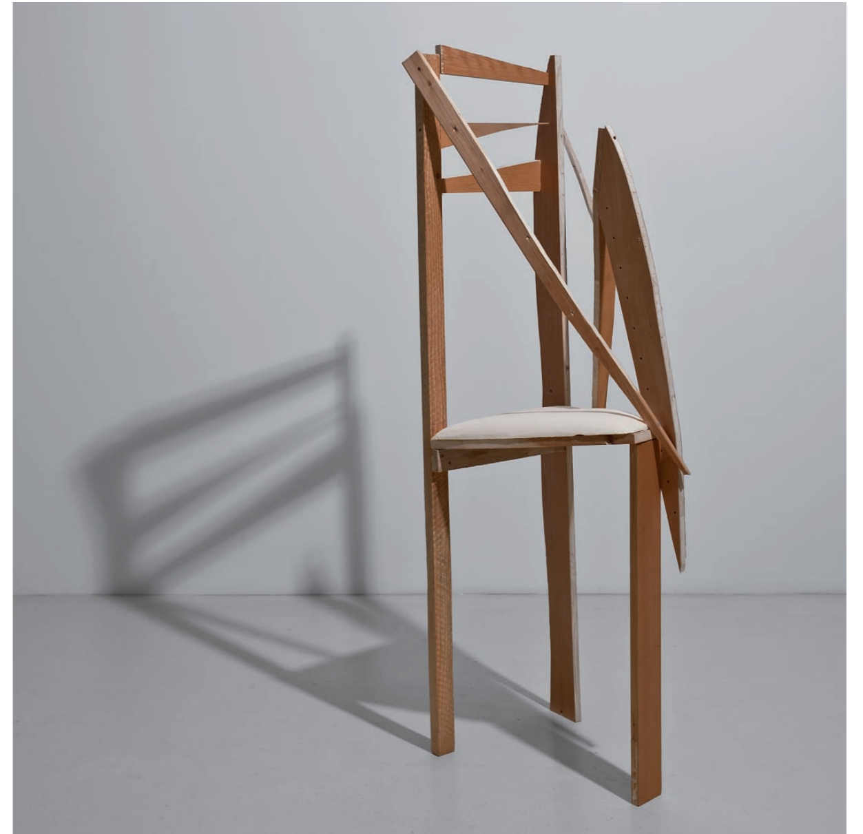
Kažimir Hrade Pretežno sunčano , 2012. panel-ploča, stirodur 158 x 56 x 43 cm