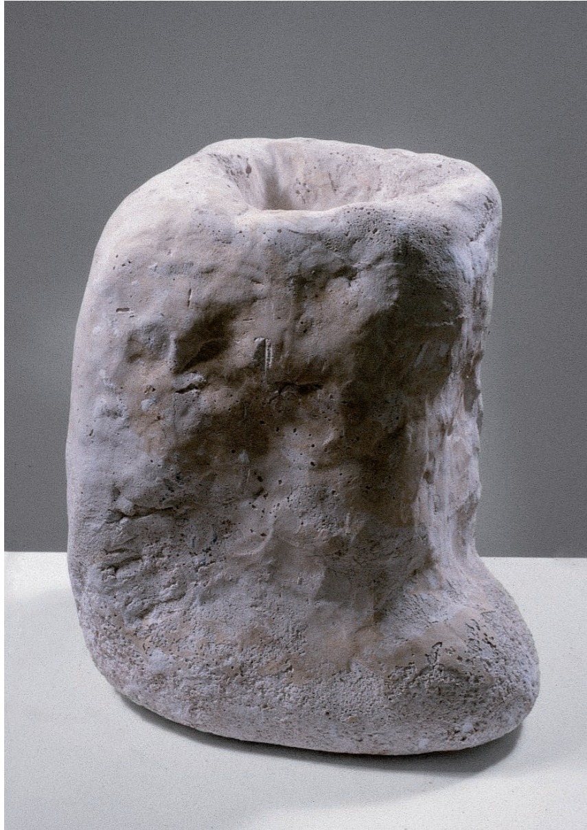
Kuzma Kovačić Zahvala benediktincima , 1983. obojeno drvo 31 x 25 x 21,5 cm