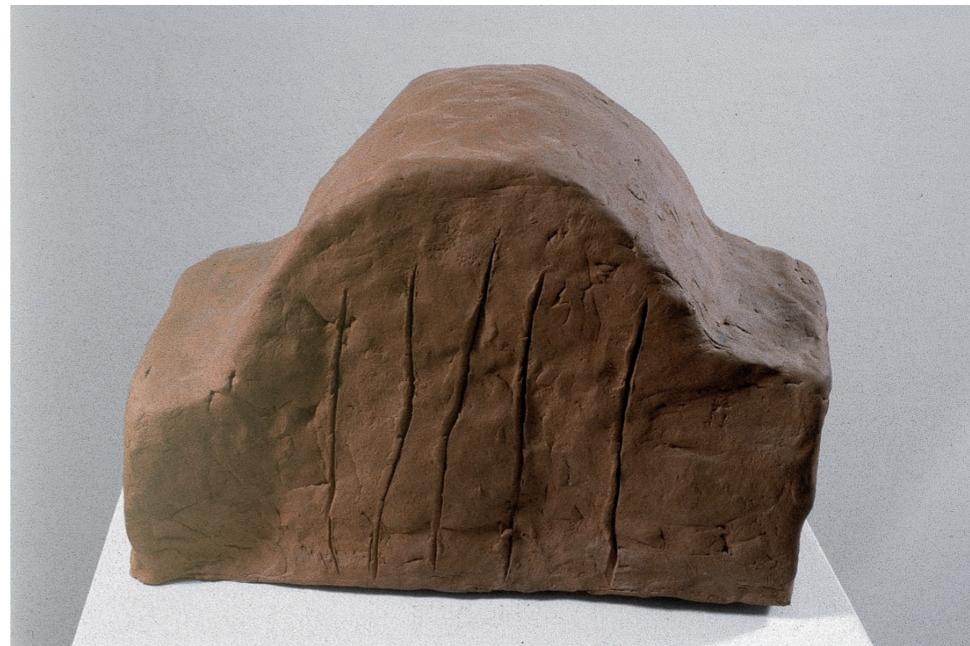
Kuzma Kovačić Putopisna bilješka , 1981. pečena zemlja 22 x 29,5 x 19,5 cm