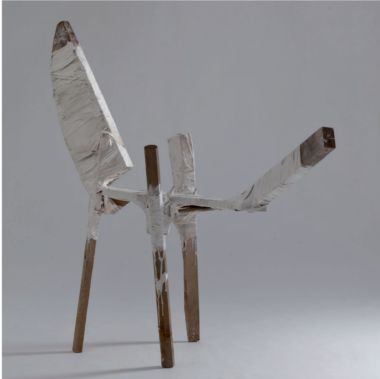
Kažimir Hraste Kišnica , 2012. aluminijски lim, drvo 85 x 83 x 100 cm