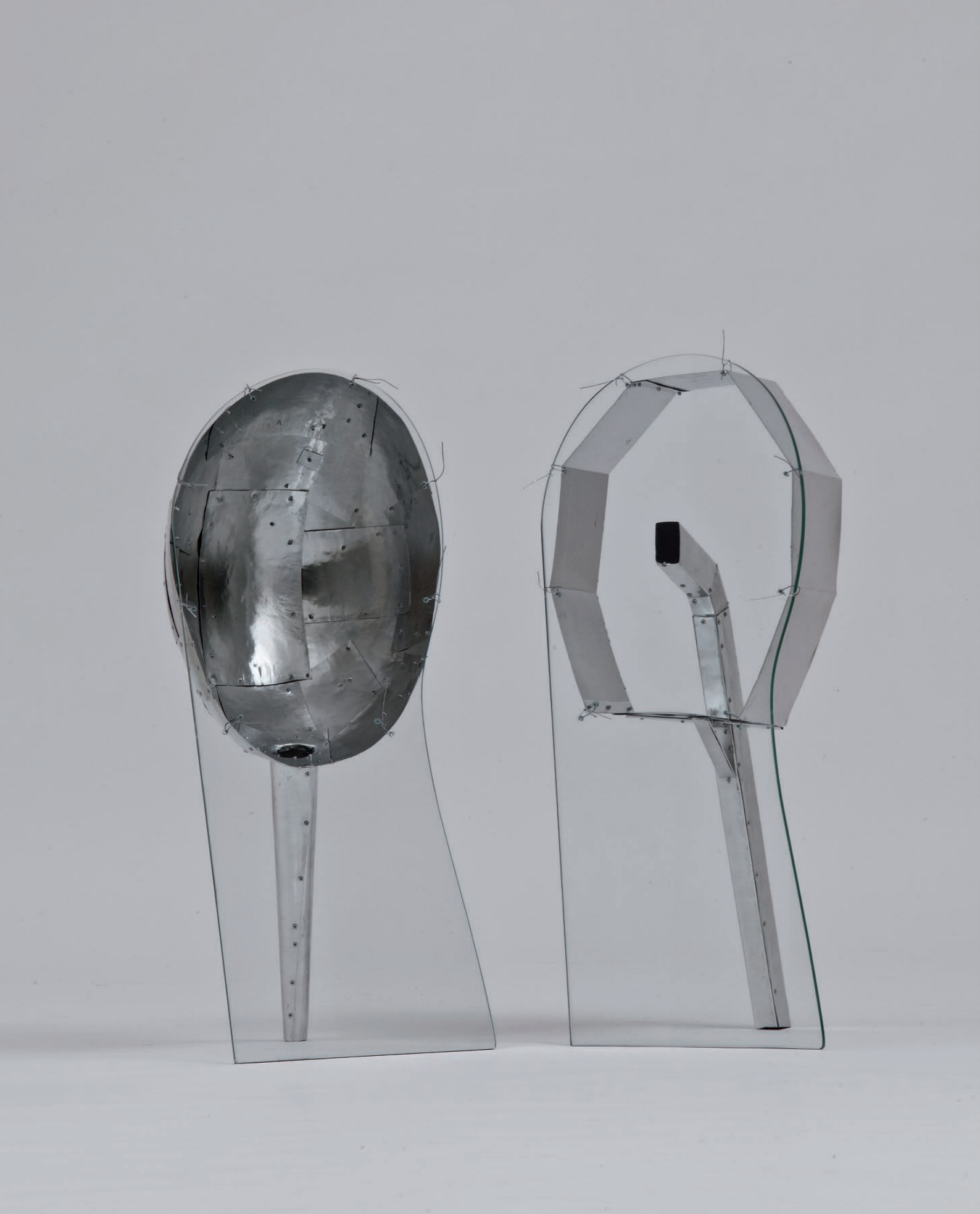
Kažimir Hrade Šototajer i njegova žena , 2012. staklo, aluminij 83 x 32 x 38 cm (x2)