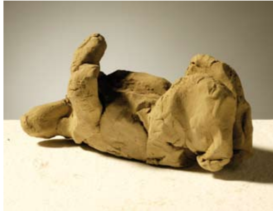
Ležeća suha glina