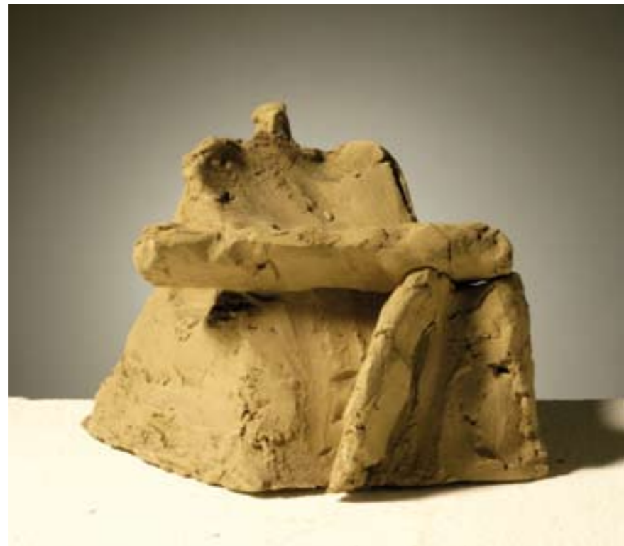
Stančić suha glina