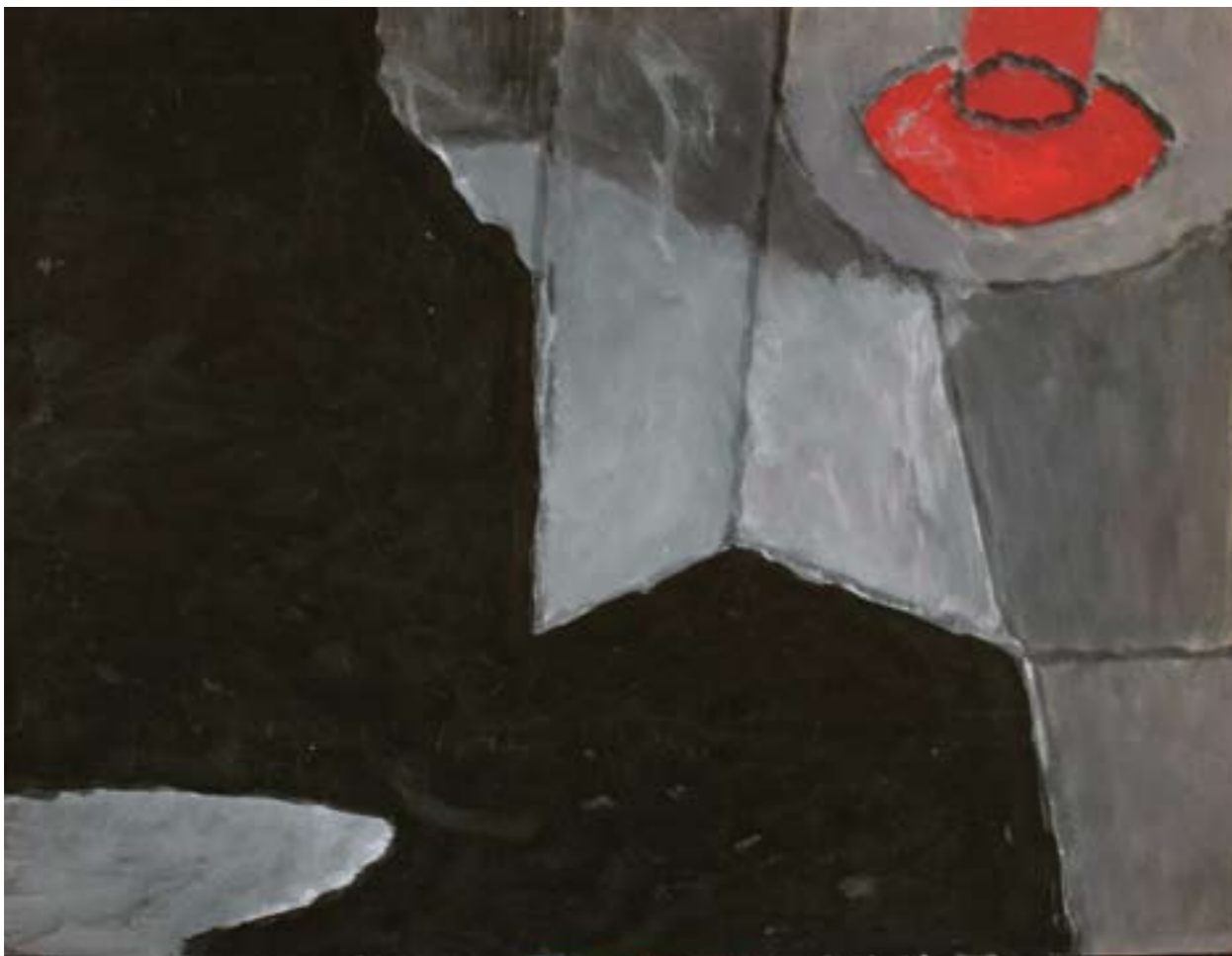
Prostor II tempera, karton