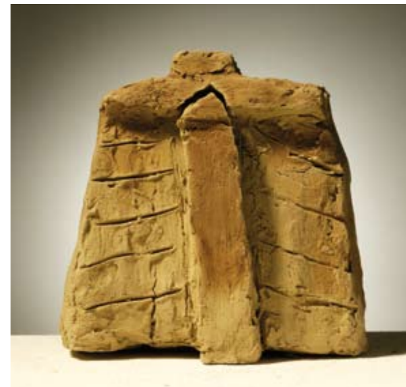
Haljina suha glina