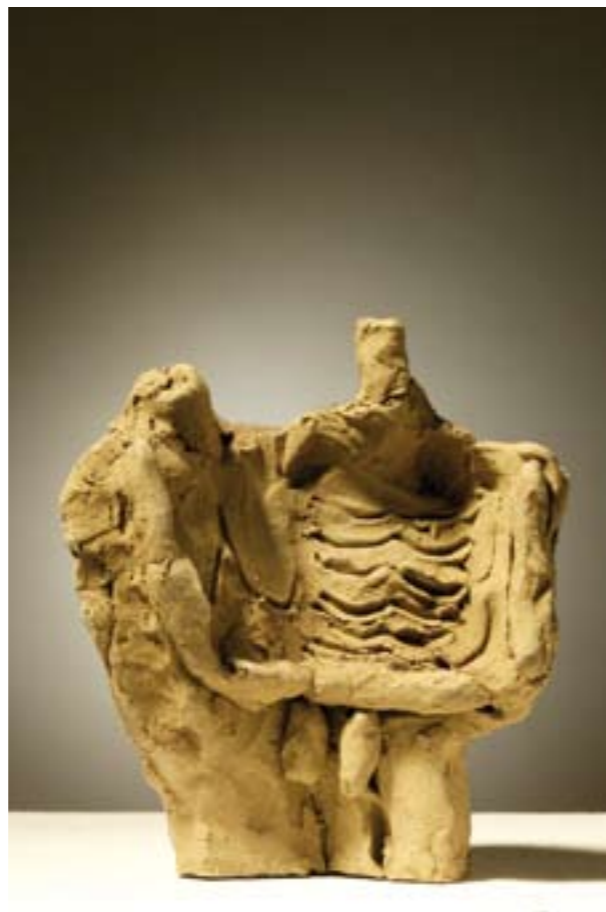
Adam i Eva suha glina