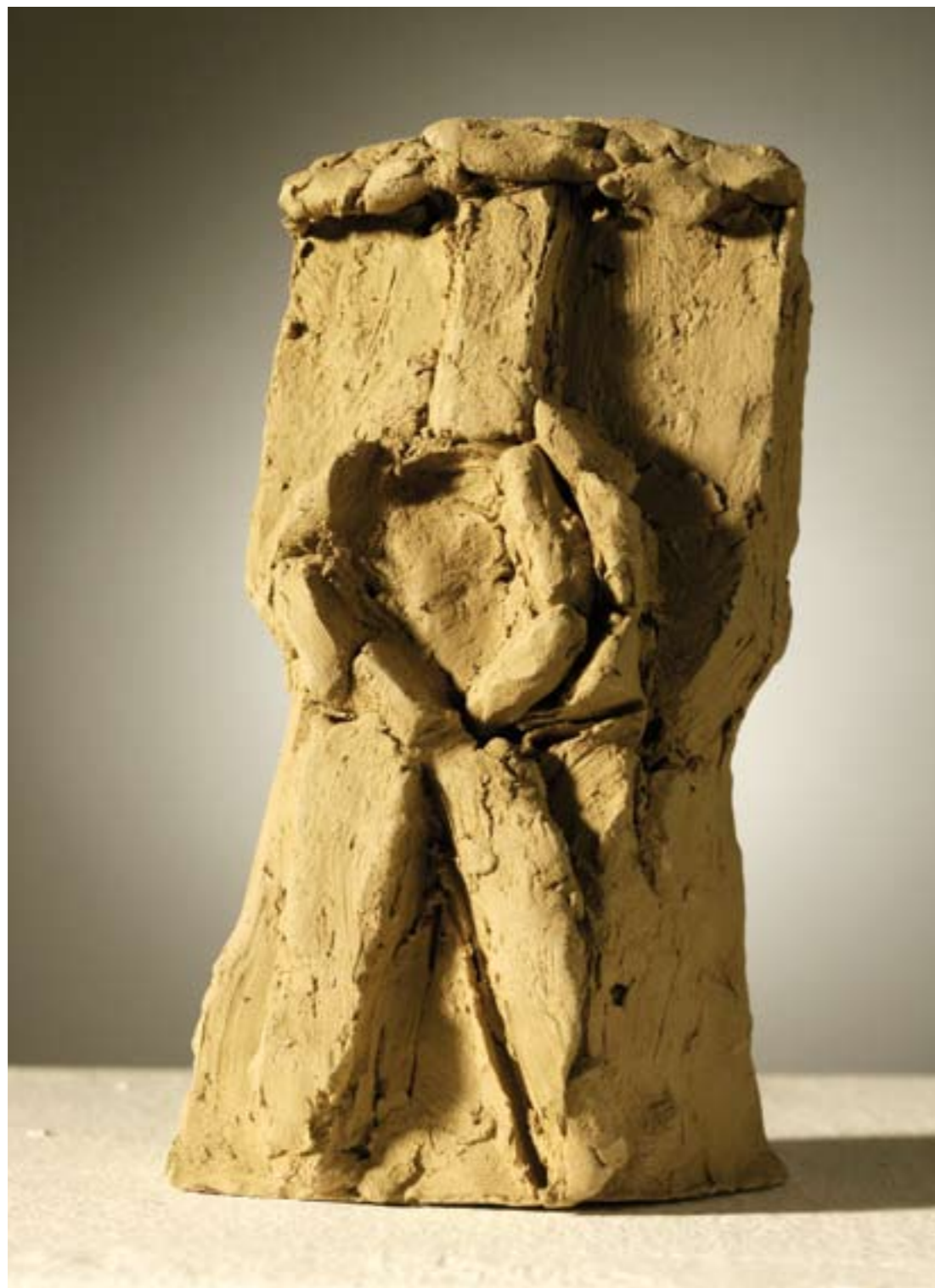
Autoportret suha glina