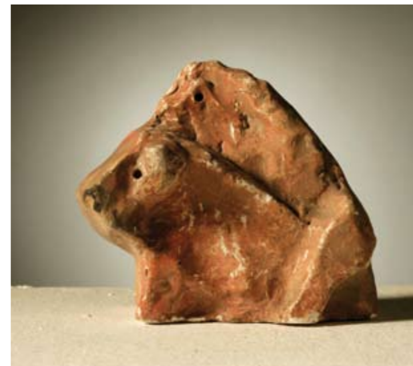
Ljubav suha glina