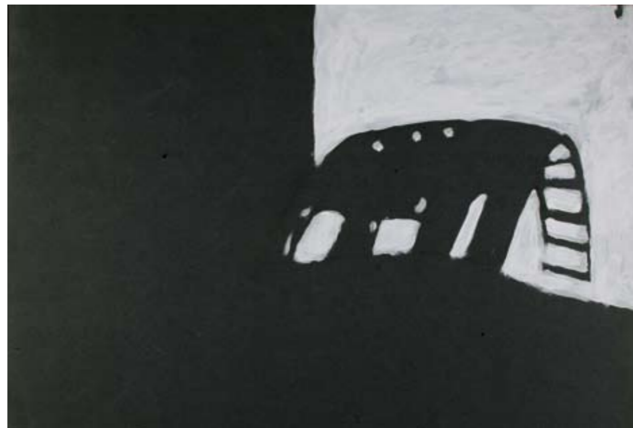
Slonovi tempera, olovka