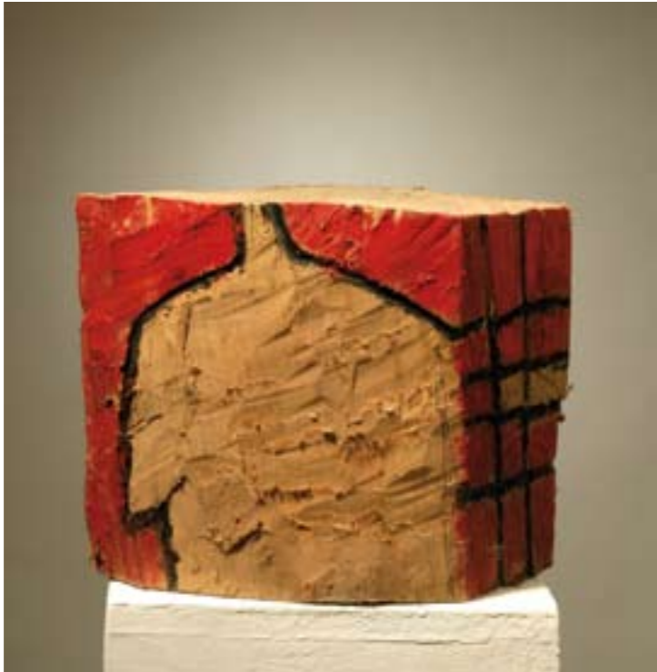
Crveno i crno drvo