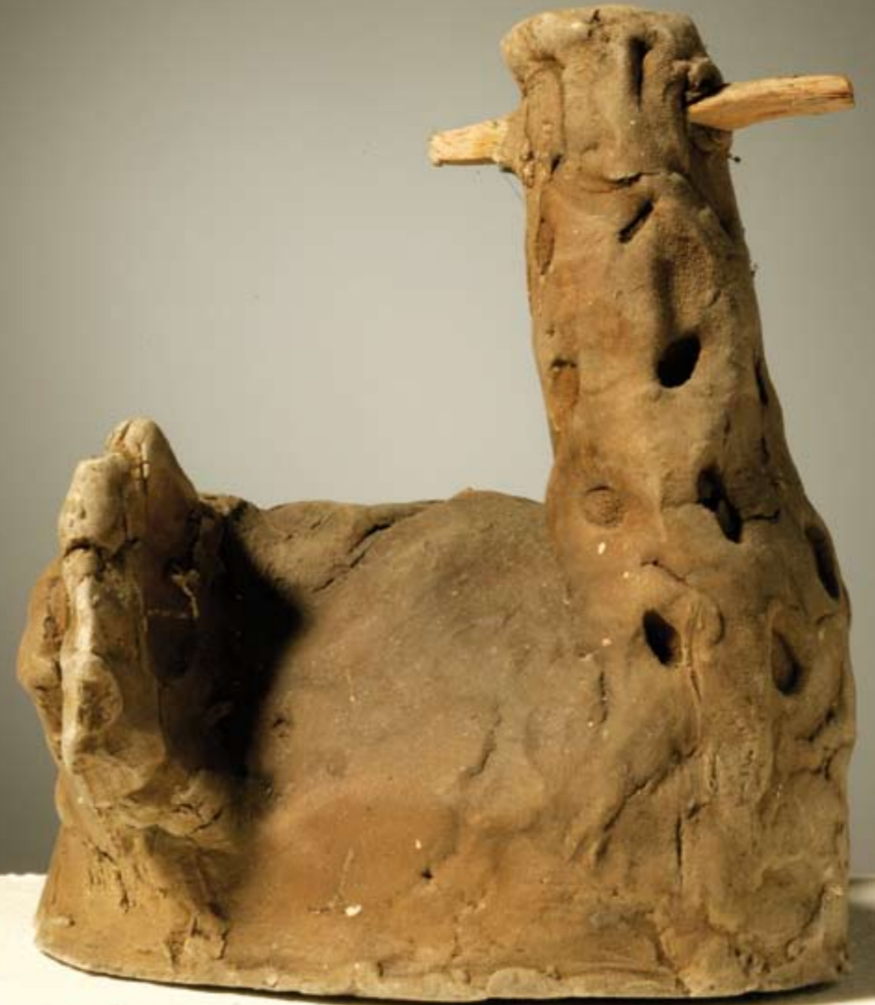
Bez naziva XXIII suha glina