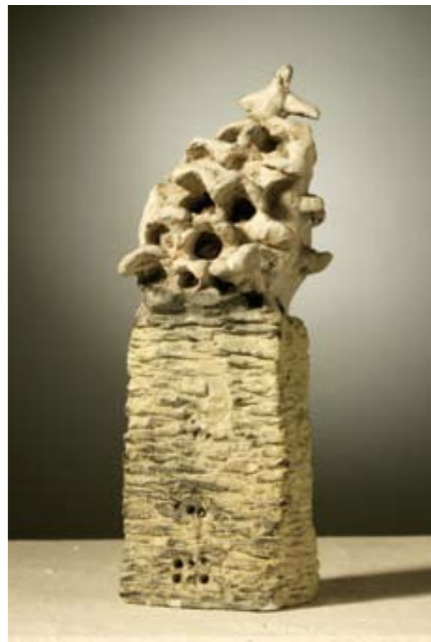
Skica za spomenik suha glina