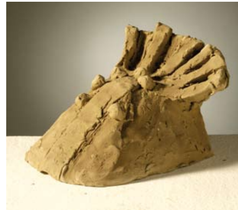
Stablo suha glina