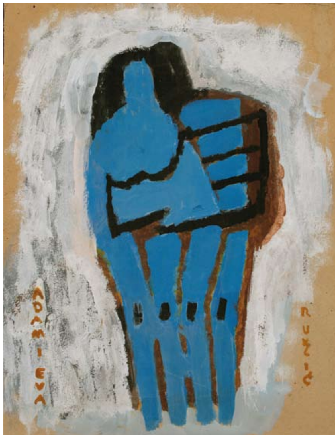
Adam i Eva tempera, karton