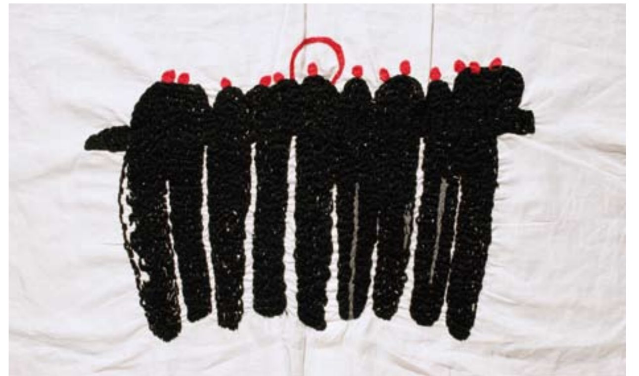
Posljednja večera 1989., iglom po platnu