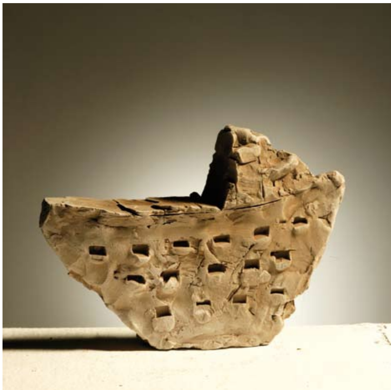
Lada suha glina