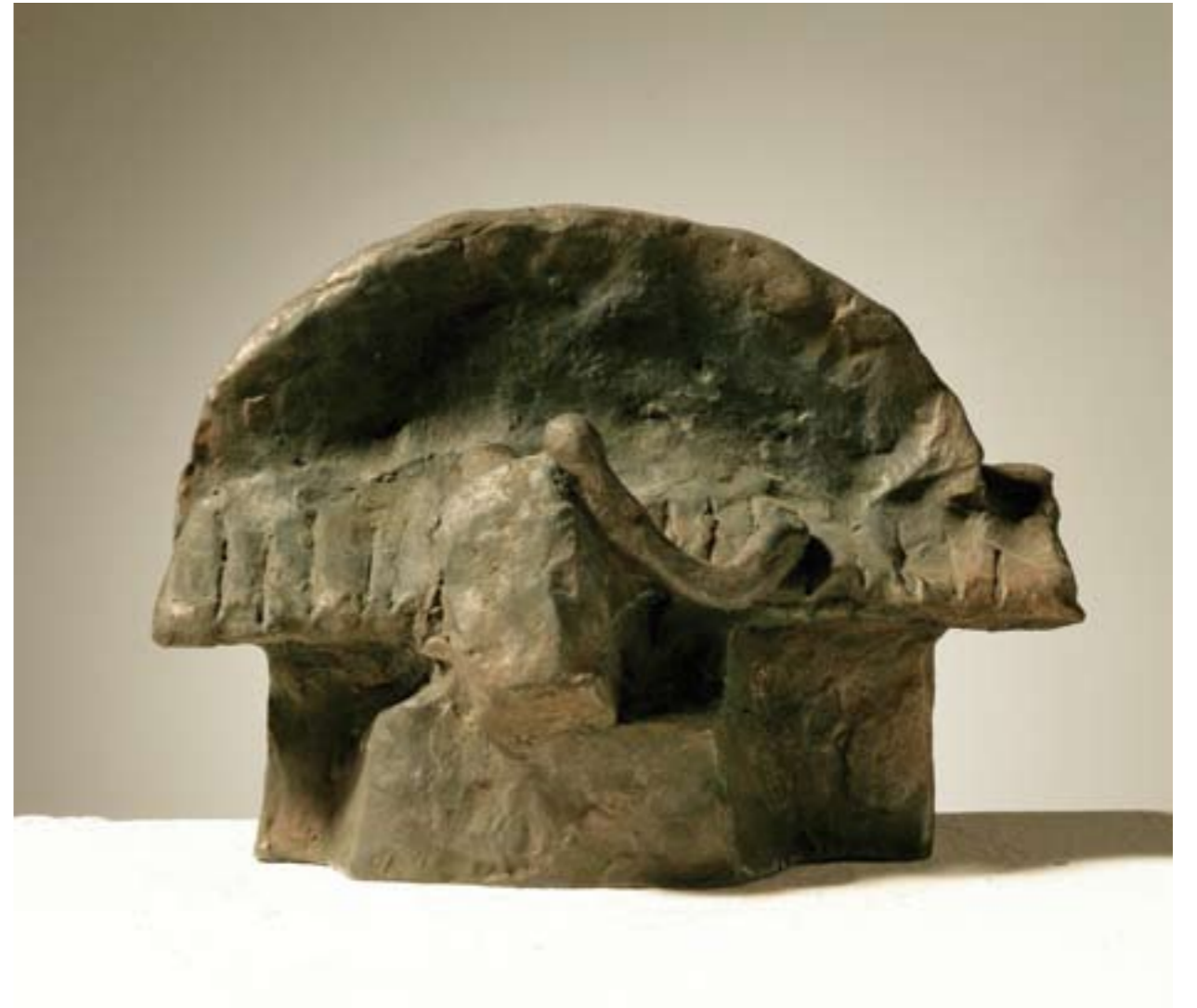
Pijanistica bez ruke bronca