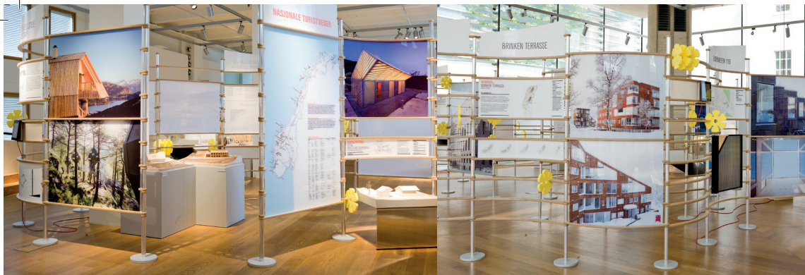
S izložbe u Nacionalnom muzeju – Arhitektura u Oslu, 2011