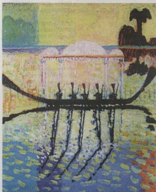
Split predstavlja izložbu Antuna Borisa Švaljeka

Akademije posvećene Dušanu Klepcu, proizvodnja Hrvatskoga radija, Zagreb, 2011.