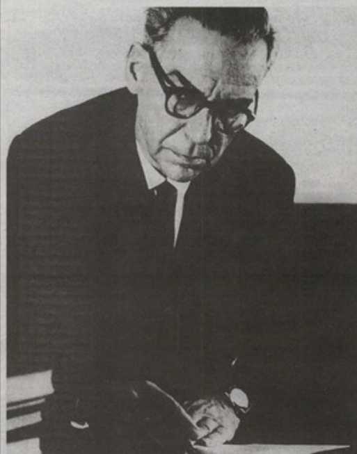
U Zavodu za povijest hrvatske književnosti, kazališta i glazbe izložit će se rukopisi nobelovca Ive Andrića

- Prikazivanje FILMA O ARHIVU I RAZGOVOR SA ZNANSTVENICIMA (čitaonica Arhiva)