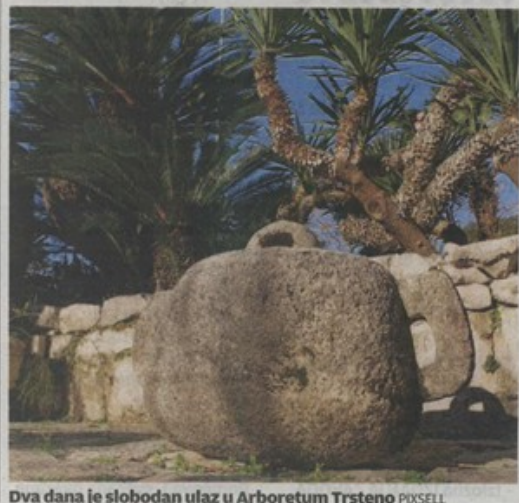
Dva dana je slobodan ulaz u Arboretum Trsteno

ZAVOD ZA ZNANSTVENI I UMJETNIČKI RAD, Županijska 9 (tel. 034/272-102)