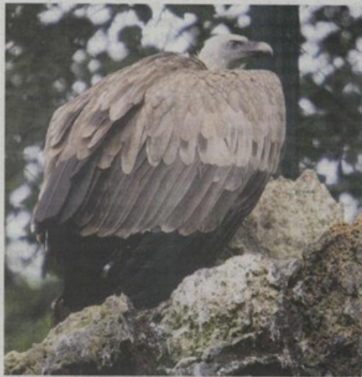
Zvijezda predavanja u Zavodu za ornitologiju je bjeloglavi sup

Prezentacija projekta DIGITALIZACIJA RUKOPISNE OSTAVŠTINE TINA UJEVIĆA i izbora iz rukopisne ostavštine Tina Ujevića u originalu i na mrežnim stranicama Akademije te mogućnosti primjene digitalizirane građe