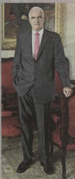
Zvonko Kusić, predsjednik HAZU

atraktivnima. Posjetitelji će upoznati znanstvenike i umjetnike te iz prve ruke čuti kako nastaju znanstvena i umjetnička djela. Sigurno će svatko naći nešto zanimljivo za sebe u raznovrsnom i bogatom programu od 4 koncerta, 24 izložbe, 56 prezentacija i predavanja, 5 promocija knjiga, 11 radionica, 9 stručnih vodstava kroz prostore i eksponate Akademije... Ukupno će biti 114 događaja, bit će obuhvaćena praktički sva područja znanosti i umjetnosti te prezentirano kulturno i umjetničko blago Hrvatske. Uvjereni smo da ćemo boljim upoznavanjem vlastitog umjetničkog i kulturnog blaga te dosezima u znanosti pridonijeti jačanju samosvijesti i toliko potrebnog samopouzdanja i optimizma u ovim prijelomnim vremenima Hrvatske uoči ulaska u Europsku uniju. Sa zadovoljstvom vas očekujemo u Hrvatskoj akademiji znanosti i umjetnosti.