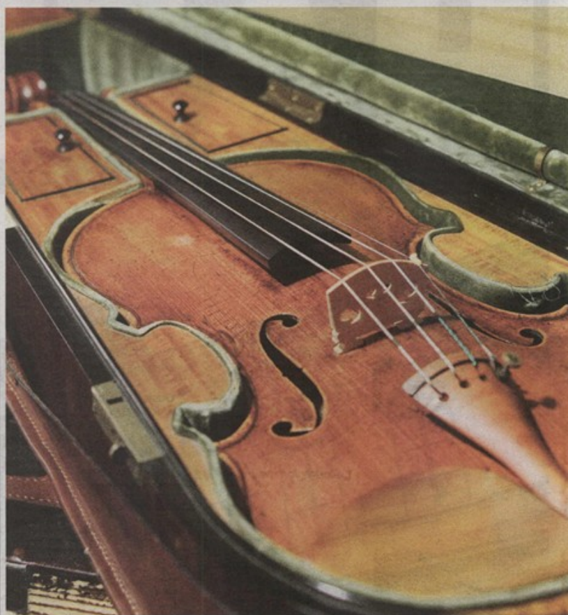
U srijedu, 14. studenoga, na slavnoj Guarnerijevoj violini King svira Oresta Shourgota

- Razgledavanje stalnog postava (II. kat palače) - Multimedijaska izložba OD ČAVLA DO ČAVLA / OD ZIDA