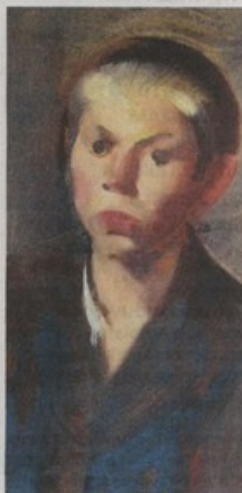
Strossmayerova galerija poziva na razgled postava

– Multimedijska izložba OD ČAVLA DO ČAVLA / OD ZIDA DO ZIDA: 608 umjetnina galerije bilo je u proteklih 6 godina posuđeno i izloženo na izložbama desetak prestižnih europskih i brojnih domaćih galerija, tako da broj posjetitelja koji su imali prilike vidjeti umjetnine iz Strossmayerove galerije zasigurno prelazi stotinu i više tisuća. Izložba prikazuje sve postaje putovanja umjetnina koje su inače skrivene posjetiteljima. Bit će prezentirani katalozi, dokumentacija i fotografije organizacije drugih izložbi na kojima su bile umjetnine iz Strossmayerove galerije. Prikazivat će se film o putovanju slike Beata Angelica Stigmatizacija