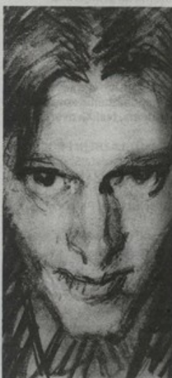
Kabinet grafike predstavlja crteže Miroslava Kraljevića

U izložbenom prostoru bit će dostupne mape s projektima koji su sačuvani u arhivu Radionice, koji su danas dio zbirke muzeja. Uz asistenciju zaposlenika muzeja te nekolicine nekadašnjih polaznika, moguće je pregledavati crteže i nacрте te se upoznati s detaljima radnog