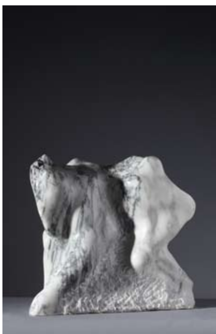
▲ Transformacija , 2004. ▲ brački kamen (sv. Petar) 86 × 48 × 45 cm