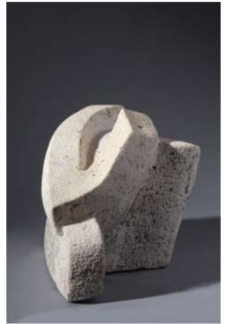
▲ Spartakus , 1999. vinkuranski kamen 31 × 30 × 47 cm