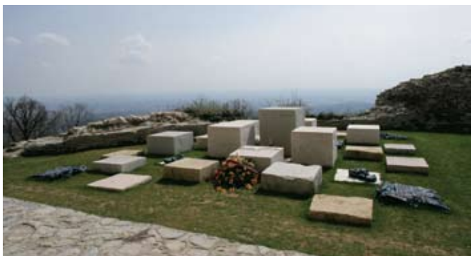
Kuzma Kovačić, Oltar domovine na Medvedgradu

Jedan od autora koji je svojim antologijskim djelima obilježio kiparstvo u Hrvatskoj u protekla dva desetljeća zasigurno je Kuzma Kovačić . U kontekstu njegovih djela javne plastike, osobito je važan kreativni iskorak u izvedbi Oltara domovine na Medvedgradu iznad Zagreba (1994.), gdje je Hrvatsku i njen grb kreativno interpretirao kamenim kubusima od raznorodnog kamena: žućkastim kanfanarom , rozalitom iz okolice Šibenika, sivobijelim segetom iz Trogira, zelenim jadrantom i smeđim dolitom iz Dugopolja, dračevicom s Brača, crvenkastim sinjskim alkasinom , sivim vapnencem iz Karlovca, slavonskim sivim granitom i žutim kamenom s Bizeka. Skulpture na ovoj izložbi – u sebe zatvoreni blokovi, s minimalnim intervencijama u masu ili naznakama grafizma na površini – vremenom nastanka omeđuju početak i kraj