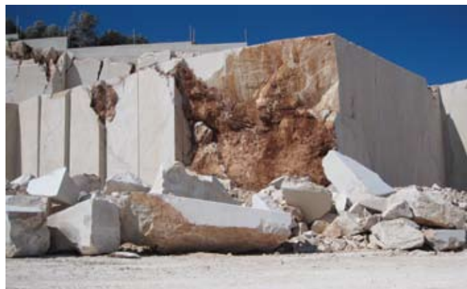
Veseljski kamen, Pučišća

Izložba koja bi oholo smjerala sveobuhvatnoj rekapitulaciji kiparskog stvaralaštva u kamenu u proteklih dvadeset hrvatskih godina, neostvariva je i besmislena ideja: velik dio skulptura ostao je živjeti na mjestima koja su nadahnula stvaranje i odredila postavljanje. No, dostupnim primjerima ukazati na značajnu produkciju u toj najzahtjevnijoj kiparskoj disciplini, svakako je potrebno: kako zbog kipara i njihovih djela, tako i zbog svih nas. Izgleda da je upravo kamenu pripala uloga da svojom čvrstom strukturom – kiparski oblikovanom – bude poveznica tradicije i suvremenosti hrvatske likovnosti.