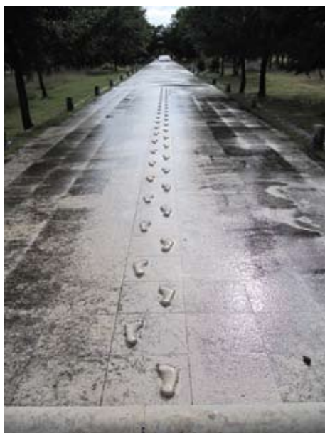
Fragment Bijele ceste, autor Nikola Džaja (snimio Davorin Vujčić, 2011.)

Mediterranski kiparski simpozij u kamenu, najznačajniji hrvatski kiparski simpozij, rođen je daleke 1969. iz nastojanja da se revitalizira barokna Stancija Dubrova kod Labina. Josip Diminić i Branko Fučić, idejni začetnici i utemeljitelji, osmislili su ga ne samo kao mjesto kiparenja i okupljanja kipara, već kao društveno dinamičnu činjenicu, s kiparskim dosezima kao povodom ljudskom sporazumijevanju. U svom četrdesetgodinšnjem postojanju MKS je priskrbio stotinjak skulptura u kamenu, postavljenih u park skulptura Dubrova i širom Hrvatske. Osobit doprinos autentičnosti i originalnosti Mediteranskom kiparskom simpoziju od 1997. godine daje Bijela cesta: pješačka cestica kroz park skulptura, koju svake godine svojom kreacijom u duljini od tridesetak metara produži jedan odabrani umjetnik. Ideja Josipa Diminića i izvedba ovog projekta, sad s već 15 dovršenih dionica, bez sumnje je relevantna u svjetskim razmjerima.