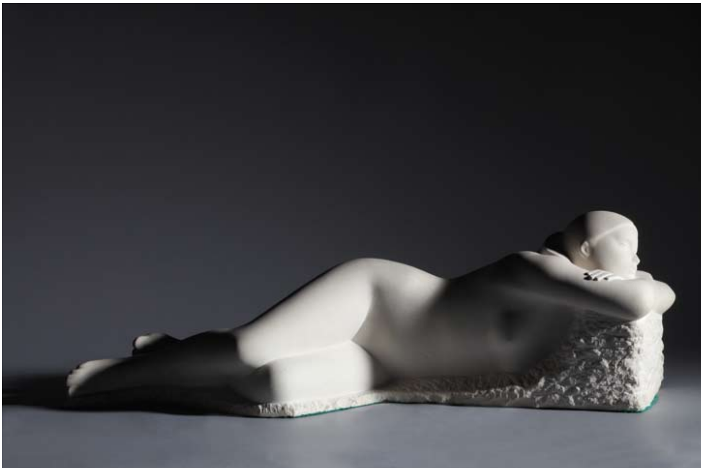
▲ Na plaži , 2006. segetski kamen 22 × 69 × 20 cm Privatno vlasništvo, Zagreb