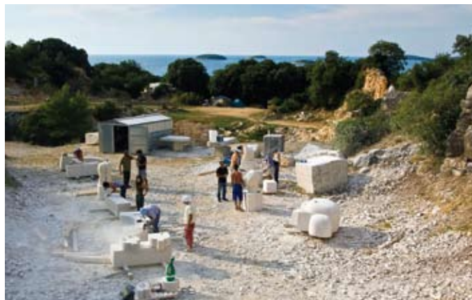
Ljetni kiparski studij, Montraker kraj Vrsara