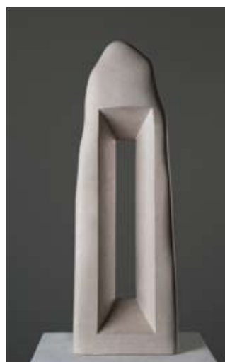
▲ Kapelica perspektiva , 1993. sivac 70 × 23 × 12 cm Snimio Ivan Kuharić, 2011. Vlasništvo Gliptoteke HAZU