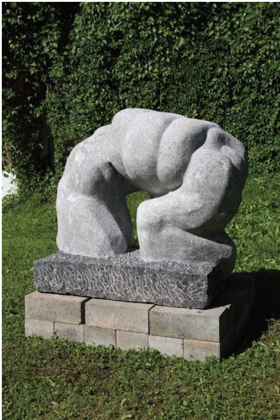
◀▲ Jarac , 1995. šareni mramor visina 45 cm