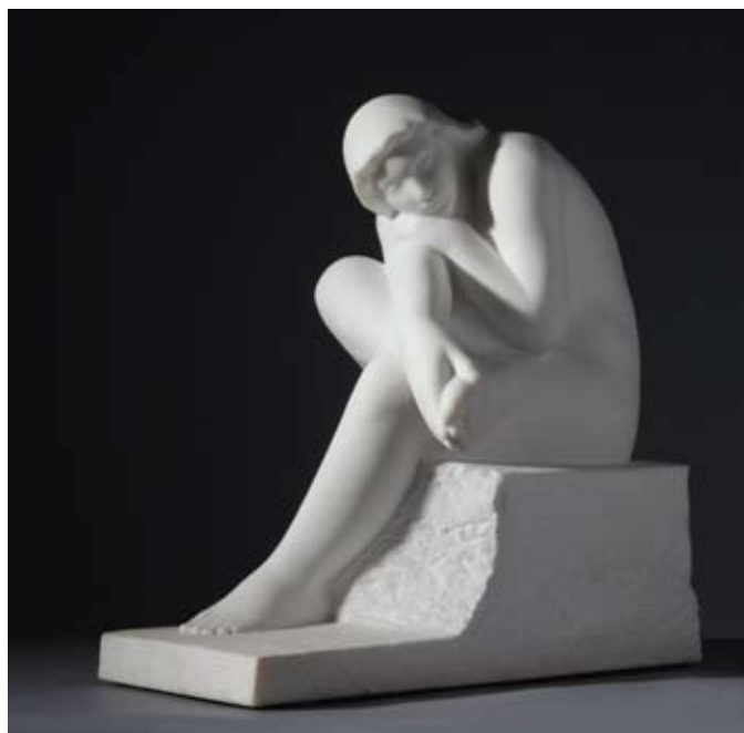
▶ Smiraj , 2007. kararski mramor 48 × 44 × 25 cm Privatno vlasništvo, Zagreb