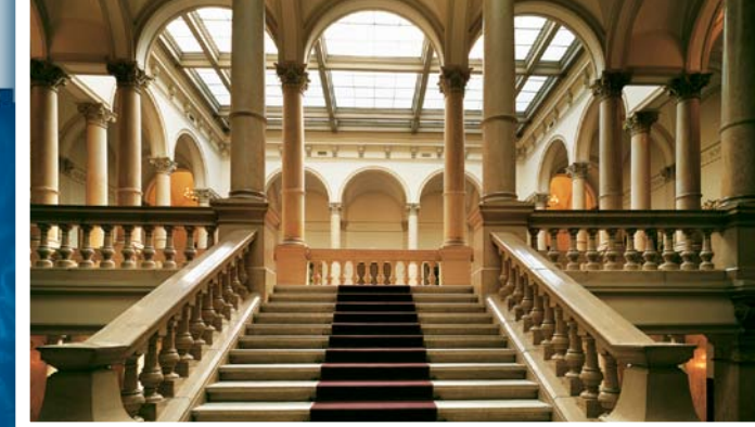
Unutrašnjost palače Hrvatske akademije

Zavod u Varaždinu svojim je brojnim i kvalitetnim aktivnostima i rezultatima stekao veliki ugled na prostoru sjeverozapadne Hrvatske. Dokaz tome je novi desetgodišnji ugovor o suradnji Hrvatske akademije, Grada Varaždina i Varaždinske županije. Za svoj ukupni rad Zavod je