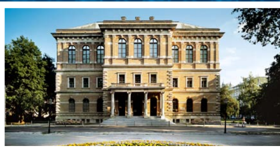
Palača Hrvatske akademije

Danas Hrvatska akademija djeluje u skladu s novim Statutom koji je 1996. potvrdio Hrvatski sabor. Organizacijski Akademija djeluje u devet Razreda, sedam Zavoda u Zagrebu, 10 Zavoda izvan Zagreba, dva istraživačka Centra, tri Kabineta i jedan Arhiv za likovne umjetnosti te pet Muzejsko – galerijskih jedinica. Zatim su tu i Arboretum Trsteno, Arhiv te Knjižnica. Uz spomenute jedinice kroz koji Hrvatska