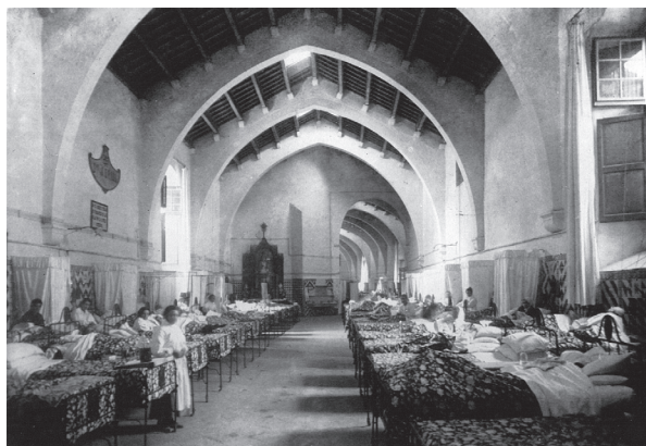
Soba bolnice u kojoj je umro Janko Polić Kamov