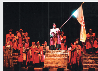
Zajc, pl. Ivan – Badalić, Hugo, Nikola Šubić Zrinski, 2004.