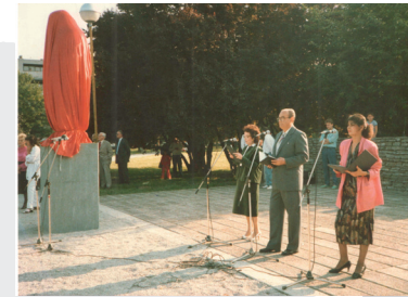
Otkrivanje spomenika Miroslavu Krleži, 1987.