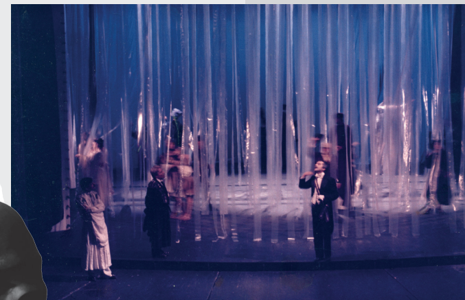
M. Krleža, Put u raj , HNK u Osijeku, 1987.