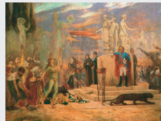
Bela Čikoš Sesija, Svečani zastor HNK u Osijeku