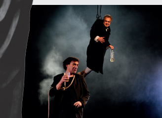
M. Krleža, Kraljevo , HNK u Zagrebu, 2009.