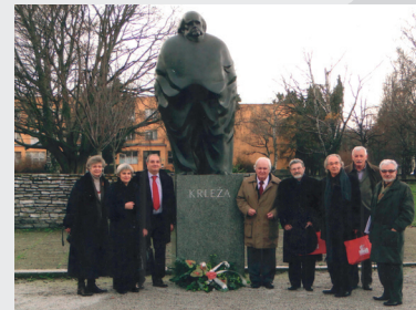
Polaganje vijenca, 2010.