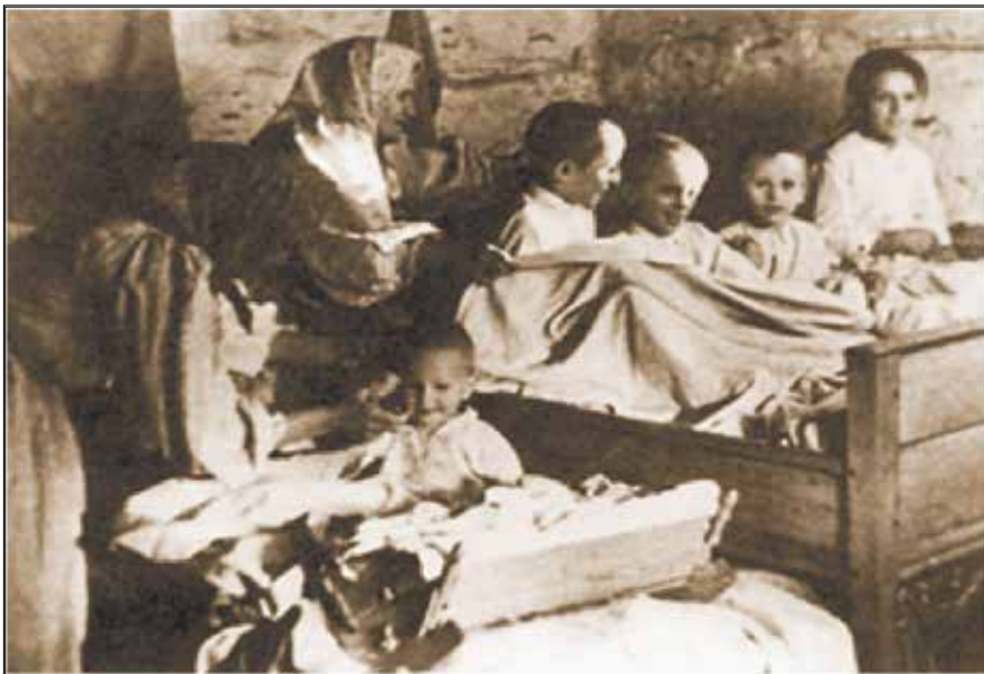
SLIKA 15. Prizor iz filma Jedan dan u turopoljskoj zadruzi snimljen 1933. u Mraclinu

Drago Chloupek na turopoljskim kajkavskom govorom kao među tekstom, koji prikazuje život u seoskoj obiteljskoj zadruzi s kraja XIX. stoljeća kako su ga se sjećali posljednji njezini živući članovi. 11 Film je sniman u Mraclinu, svi su glumci bili iz Mraclina. Tijekom snimanja filma sve su potrebne rekvizite prikupljali mještani, a snimao se u originalnim kućama i prostorima u Mraclinu. Dr. Chloupek je svakodnevno dogovarao i određivao dužnosti za sljedeći dan. 9 Film je snimio 1933. Gerasimov, a nagrađen je prvom nagradom na festivalu etnografskoga filma 1960. u Firenzi. Aleksandar Gerasimov, hrvatski filmski redatelj, konstruktor i fotograf ukrajinskog podrijetla, od 1930. do 1960. bio je snimatelj Škole narodnog zdravlja. 13 (slika 15).