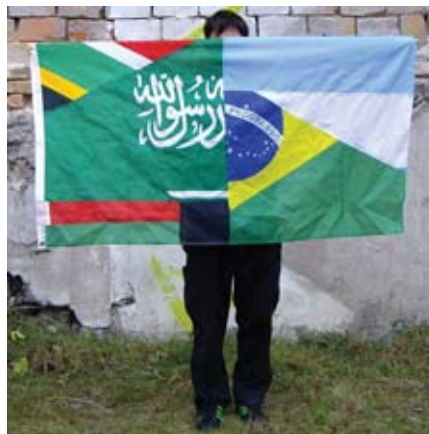
Slang International 'Coexistence 3'