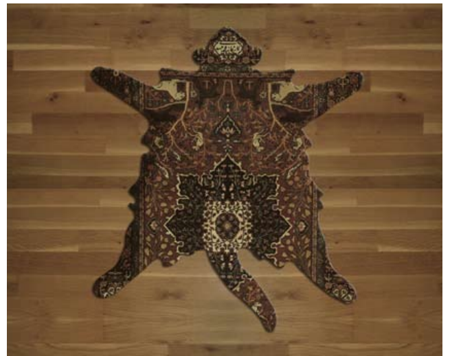
Unzine - ilustracija iz drugog broja