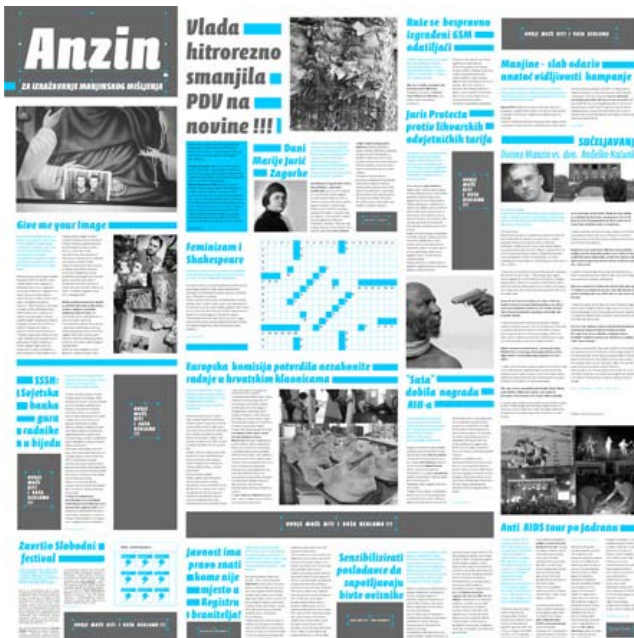
Unzine # 3