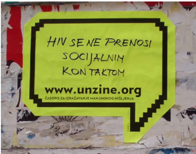
Unzine - promotivna kampanja na samoljepljivim naljepnicama u obliku 'strip oblačića' s internetskom adresom i praznim prostorom u kojem su građani / građanke upisivali vlastite komentare www.flickr.com/photos/unzine_mag