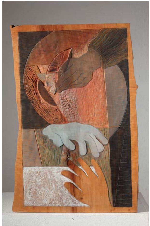
2. RUKA I RUKAVICA II