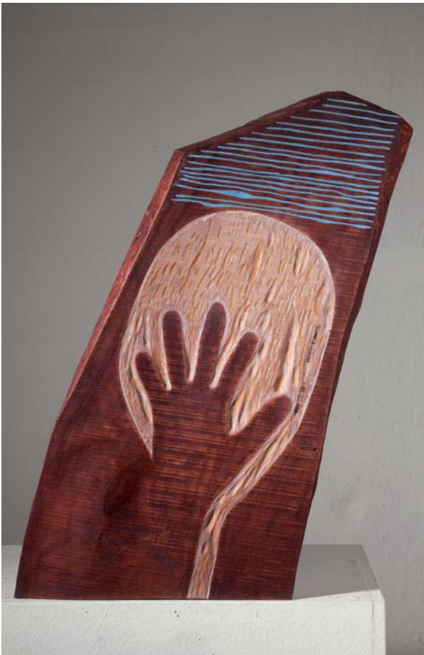
18. MODELIRANJE LICA