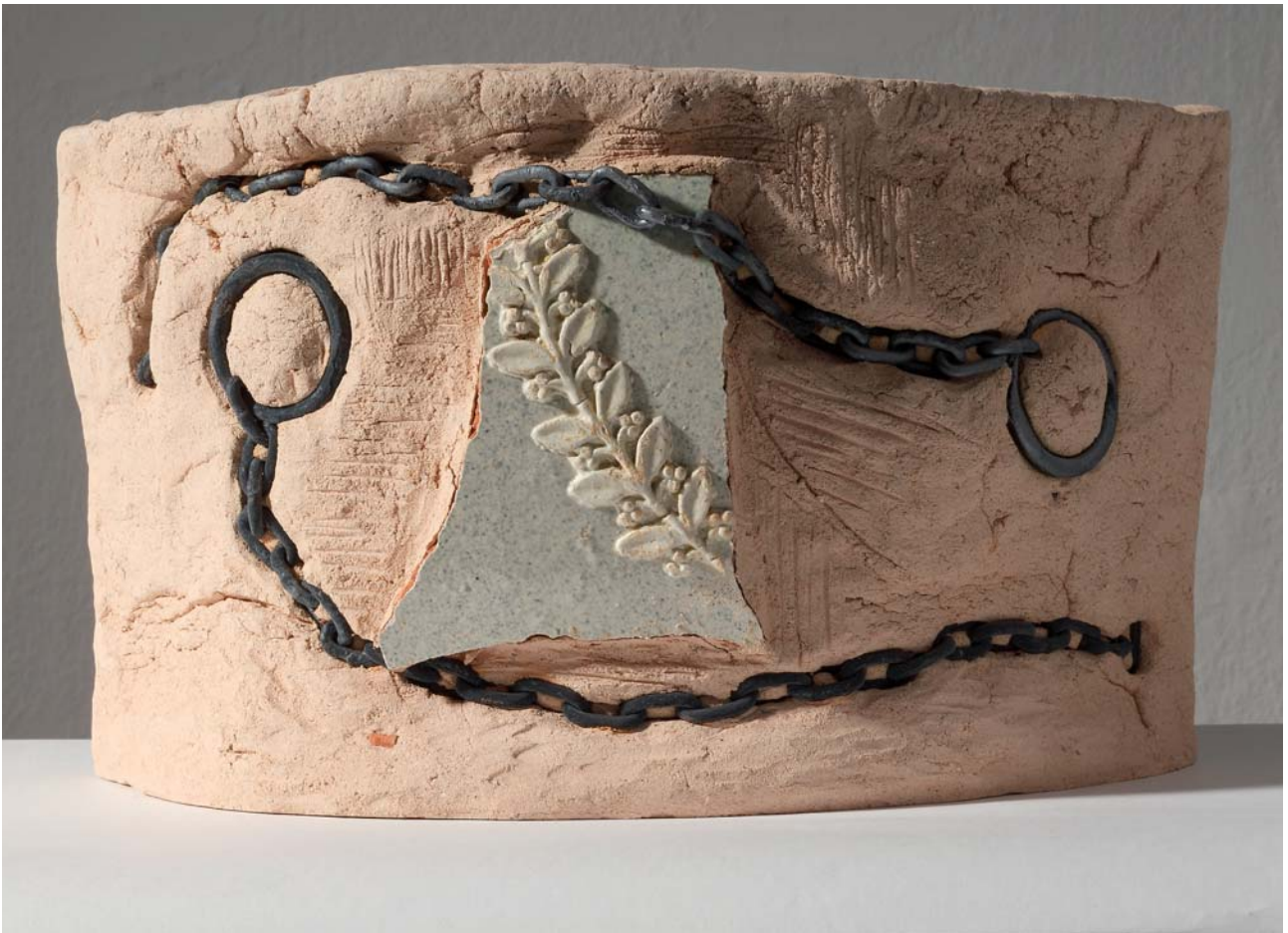
9. 1-15 ZIDOVI SJEĆANJA