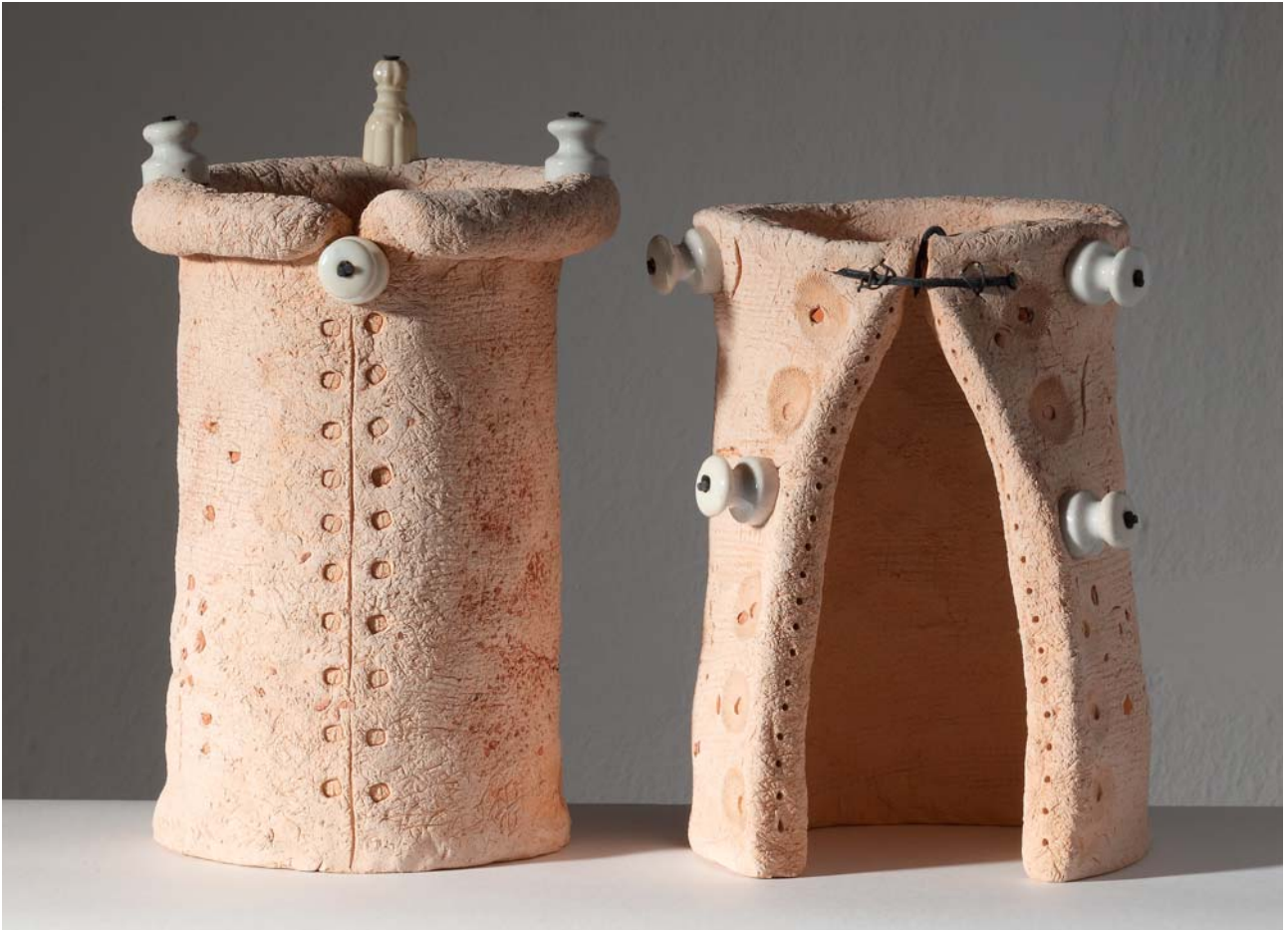
4. KULA KRALJICA