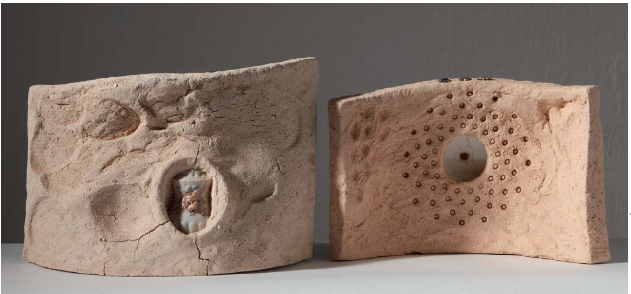
9. 1-15 ZIDOVİ SJEĆANJA