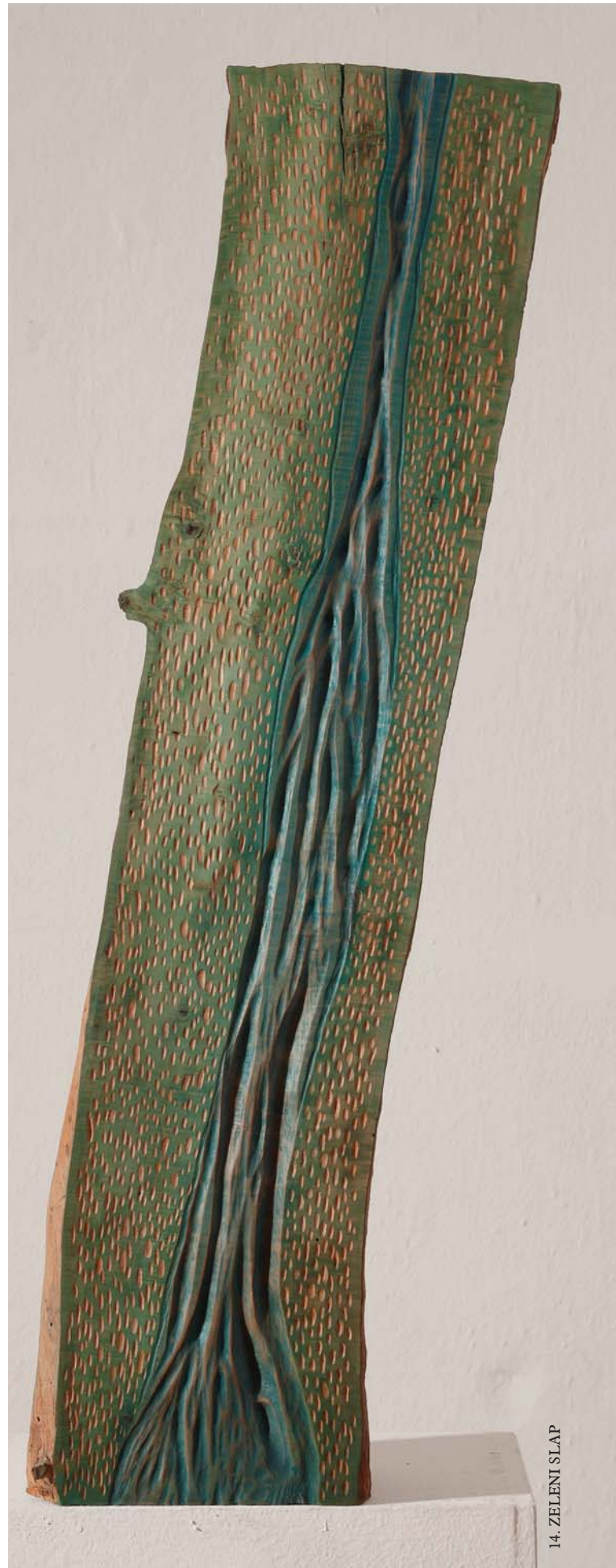
14. ZELENI SLAP