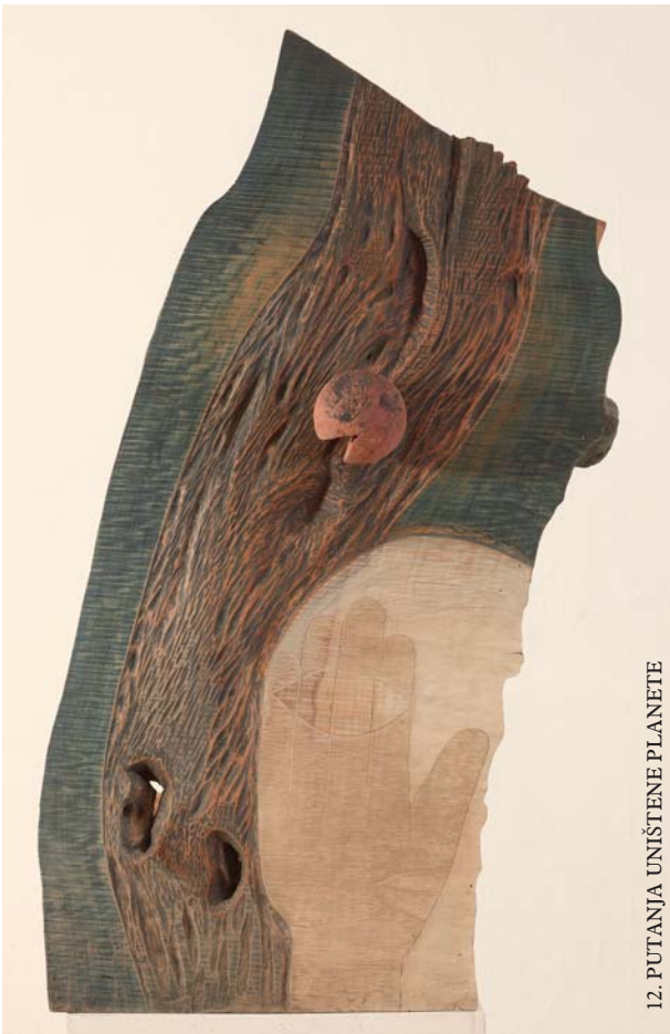
12. PUTANJA UNIŠTENE PLANETE