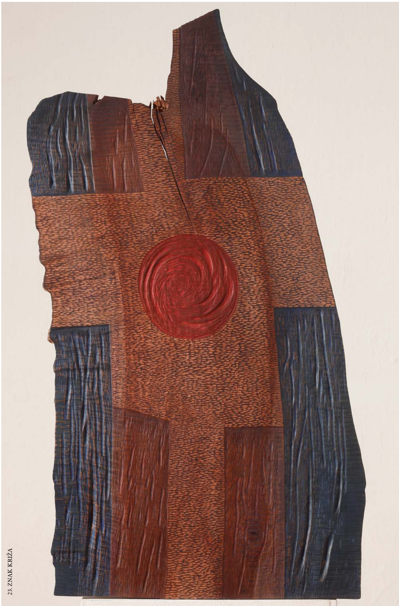
23. ZNAK KRIŽA