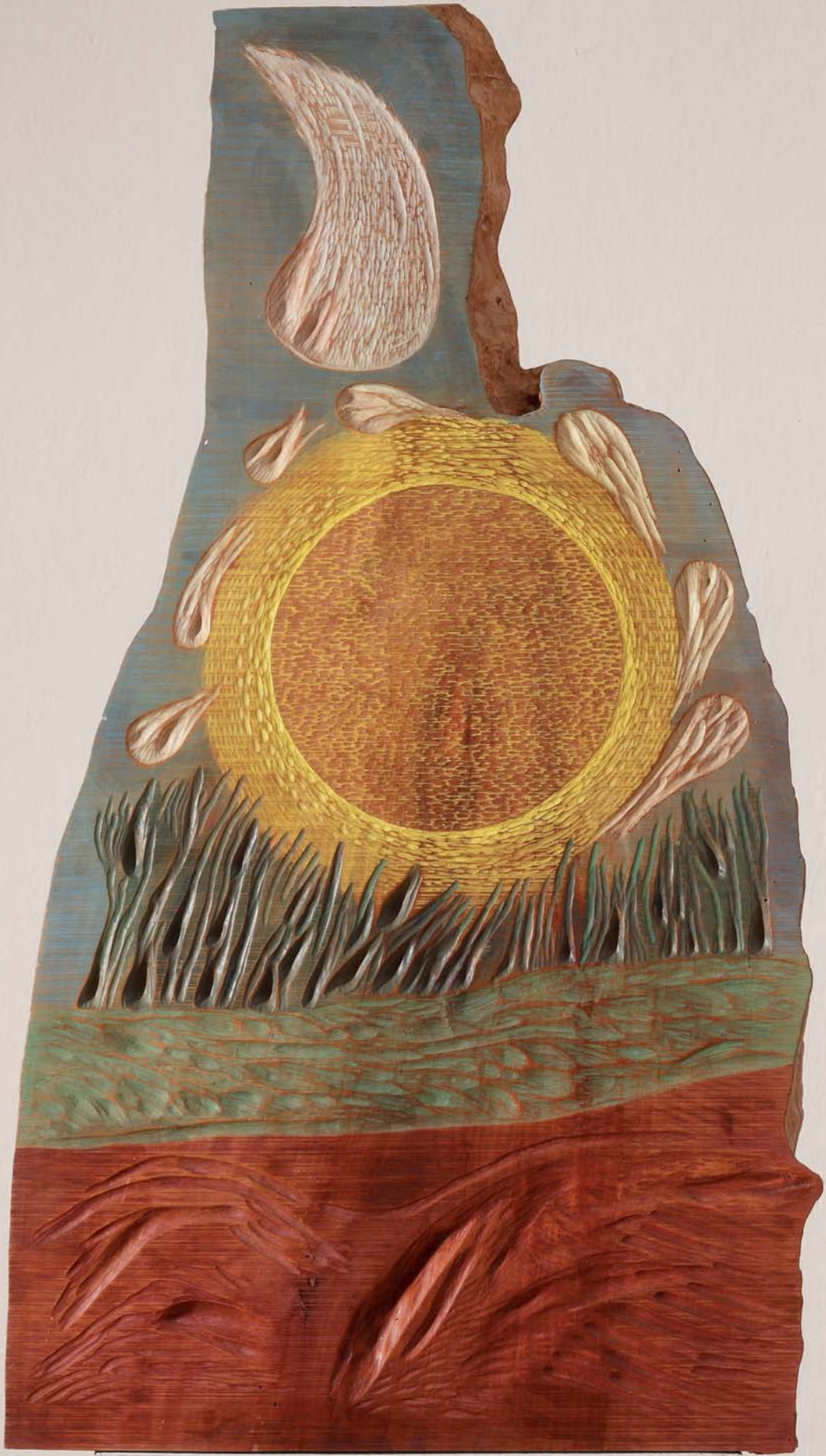
21. HOMMAGE SV. FRANJI ASIŠKOM