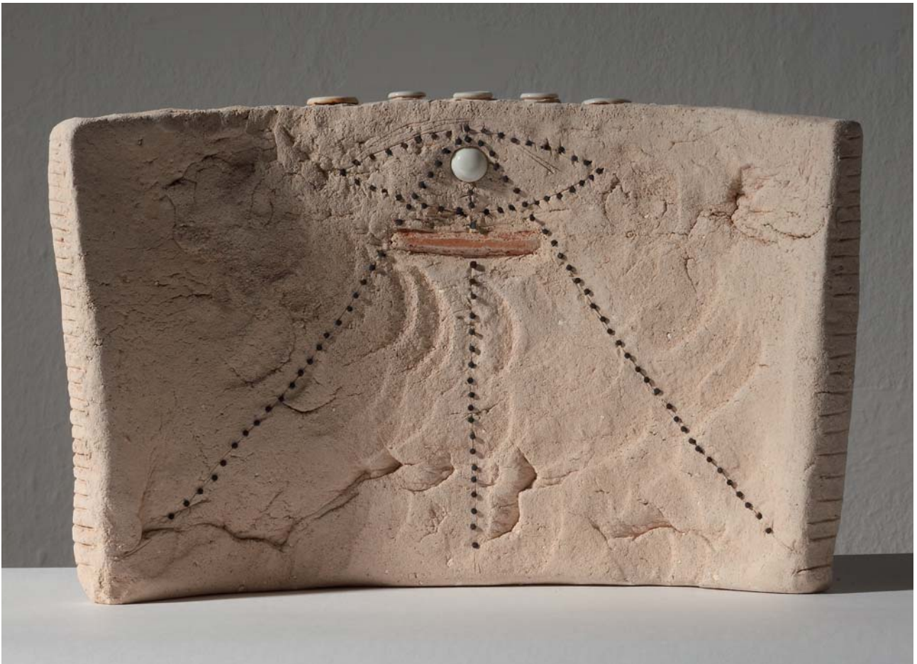
9. 1-15 ZIDOVI SJEĆANJA