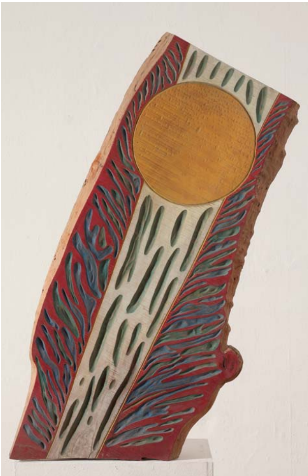
13. HOMMAGE À MOZART