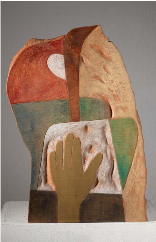
4. ZLATNA RUKA