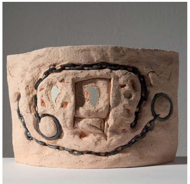
9. 1-15 ZIDOVJI SJEĆANJA