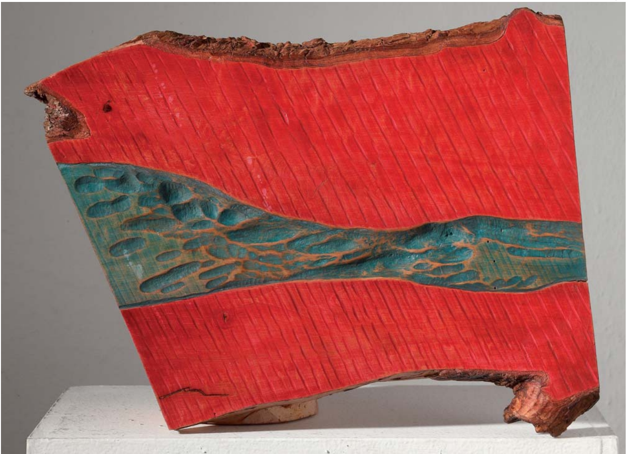
16. CRVENA PUSTINJA