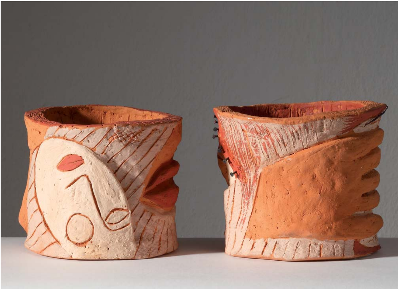
1. 1-2 RUKA TRÁŽI LICE