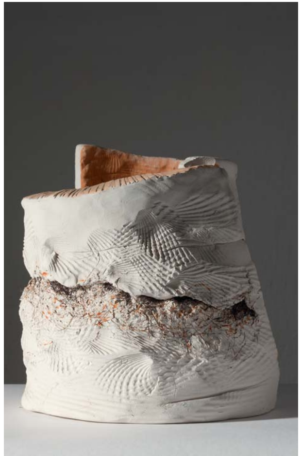
2. 1-5 SAN WISŁAWE SZYMBORSKE