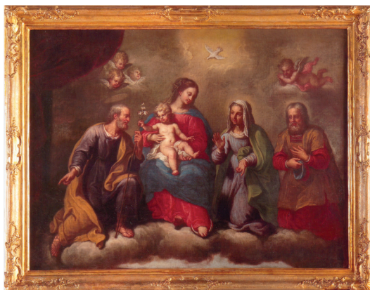
Domenico Uberti, (spominje se u Veneciji 1733.) Sv. Obitelj sa Joakimom i Anom, prva polovica 18. stoljeća, ulje na platnu, 97 x 126 cm, Šibenik, crkva sv. Nikole (gore: prije restauriranja, dolje: nakon restauriranja)

stanje te određivali prioriteta restauriranja. Stvoren je model gotovo idealnog pristupa pokretnoj kulturnoj baštini u najbliskijem mogućem dodiru s umjetninama prije, za vrijeme i poslije procesa restauriranja. Od prvog splitskog restauratora Filipa Dobroševića, koji je svoj profesionalni put započeo iste 1954. godine, u nekoliko sljedećih godina već ih je bilo četvorica: Tomislav Tomas, Špiro Katić i Slavko Alač su uz Dobroševića restaurirali gotovo cjelokupni opus Blaža Jurjeva Trogirana i Dujma Vučkovića, dubrovačko raspelo Paola Veneziana, djela Lovre Dobričevića, Nikole Božidarevića i Mihajla Hamzića, Lorenza Lotta i mnogih poznatih i nepoznatih umjetnika u rasponu od 13. do 20. stoljeća. Restaurirane