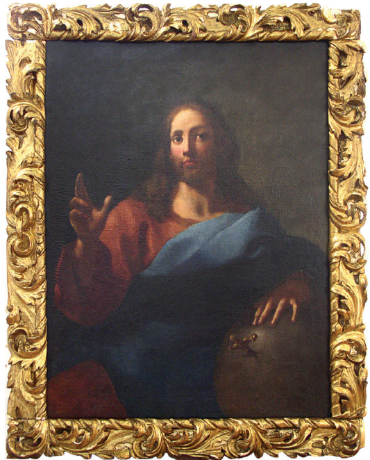
Mletački slikar, Krist Pantokrator, prva polovica 18. stoljeća, ulje na platnu, 114 x 86,5 cm, Split, crkva sv. Križa

Prvo gotovo tridesetogodišnje razdoblje slijedi tadašnje spoznaje i tehničke postupke