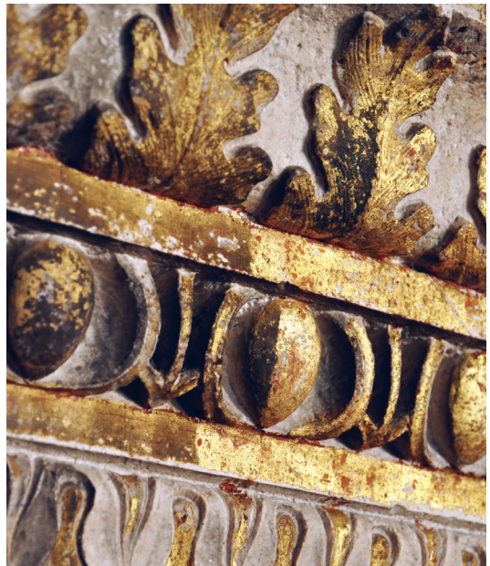
Detalj vijenca u svetištu, 15. st., katedrala sv. Jakova, Šibenik

Izvođeci od 2003. godine veliki projekt konzervatorsko-restauratorskih radova na Peristilu Dioklecijanove palače u Splitu, Odsjek za kamenu plastiku se snažno i brzo razvijao