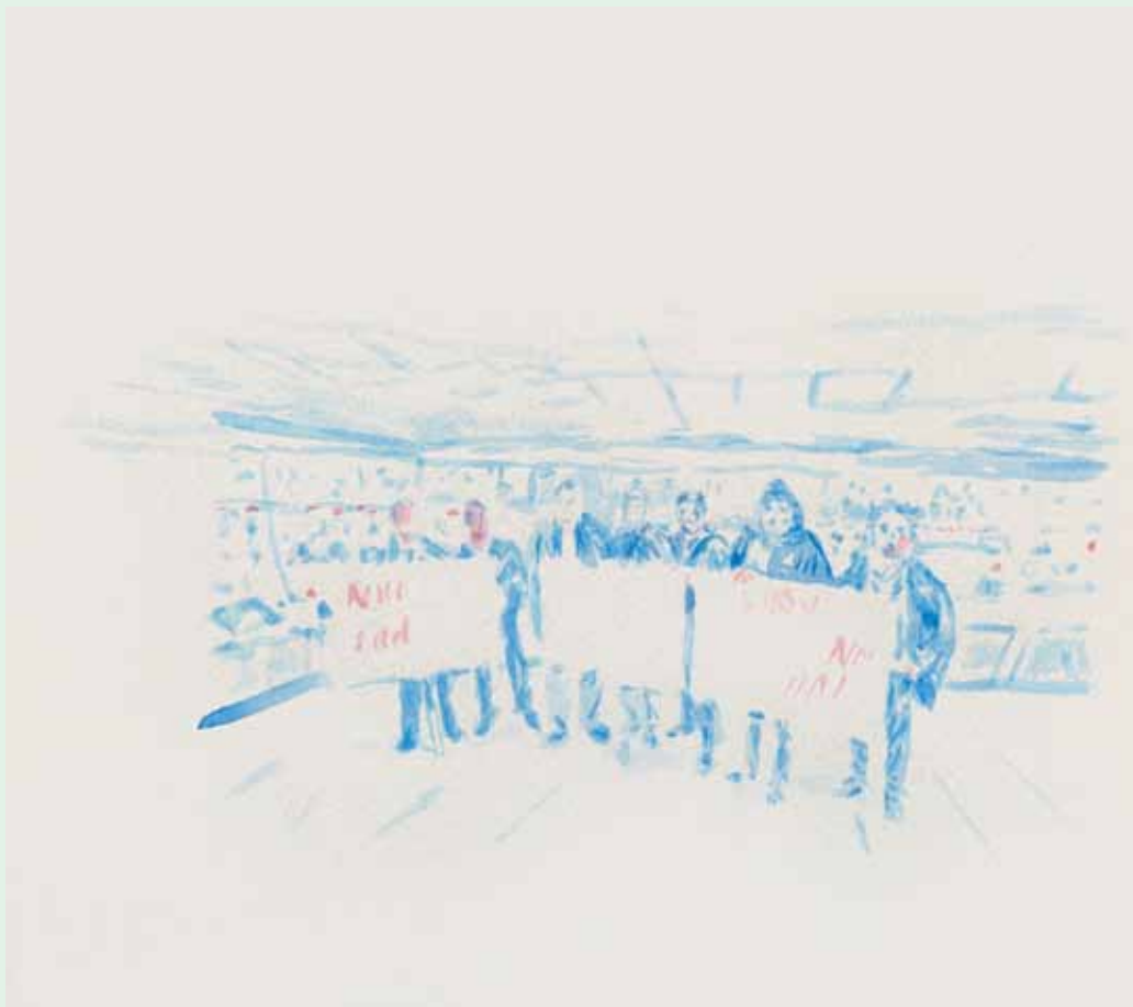
Protest, akril na papiru, 34x33cm

Inspiracija mojeg novog ciklusa slika proizlazi iz dvaju smjerova. Osnovnu motivaciju za nastanak ovih radova sačinjavali su prosvjedi protiv Vlade RH u 2011. godini u kojima sam i sam sudjelovao.