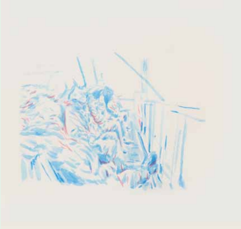
Protest, akril na papiru, 34x33cm

U tom trenutku bio sam svjestan kako je nekakva promjena unutar sustava nužna i osjećao sam se dužnim aktivno sudjelovati.