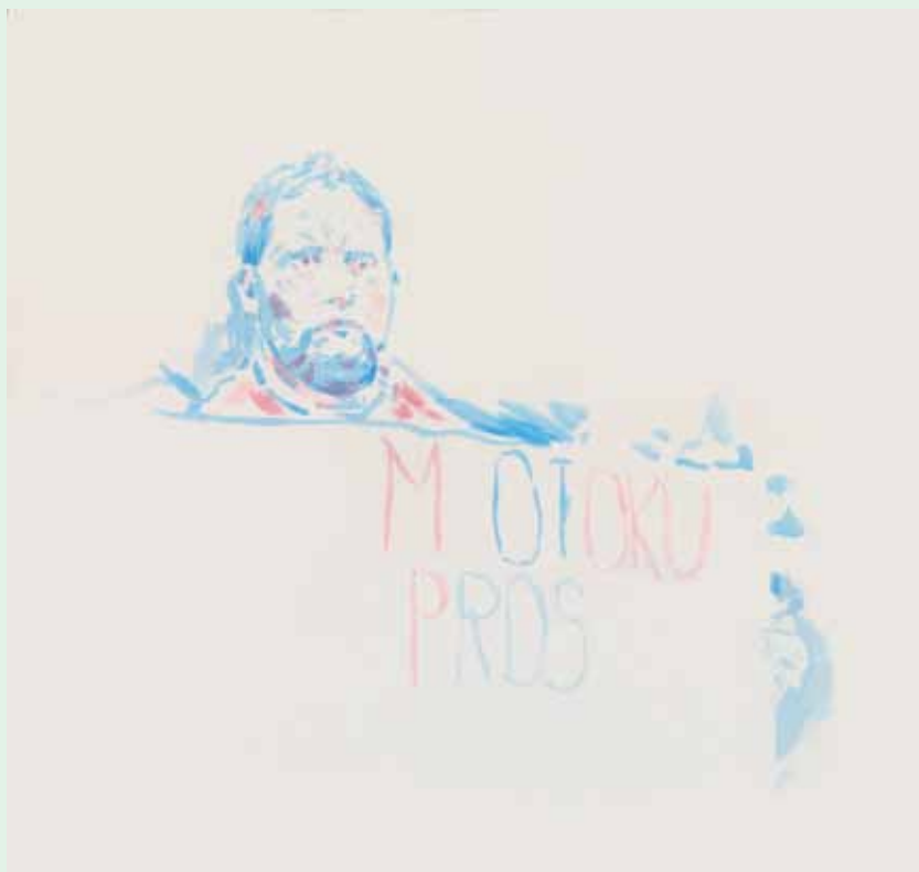
Protest, akril na papiru, 34x33cm