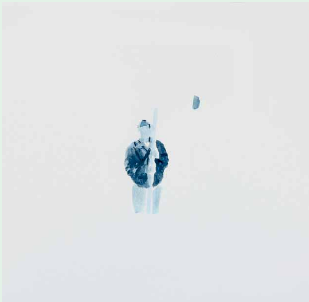
Protest, akril na papiru, 34x33cm