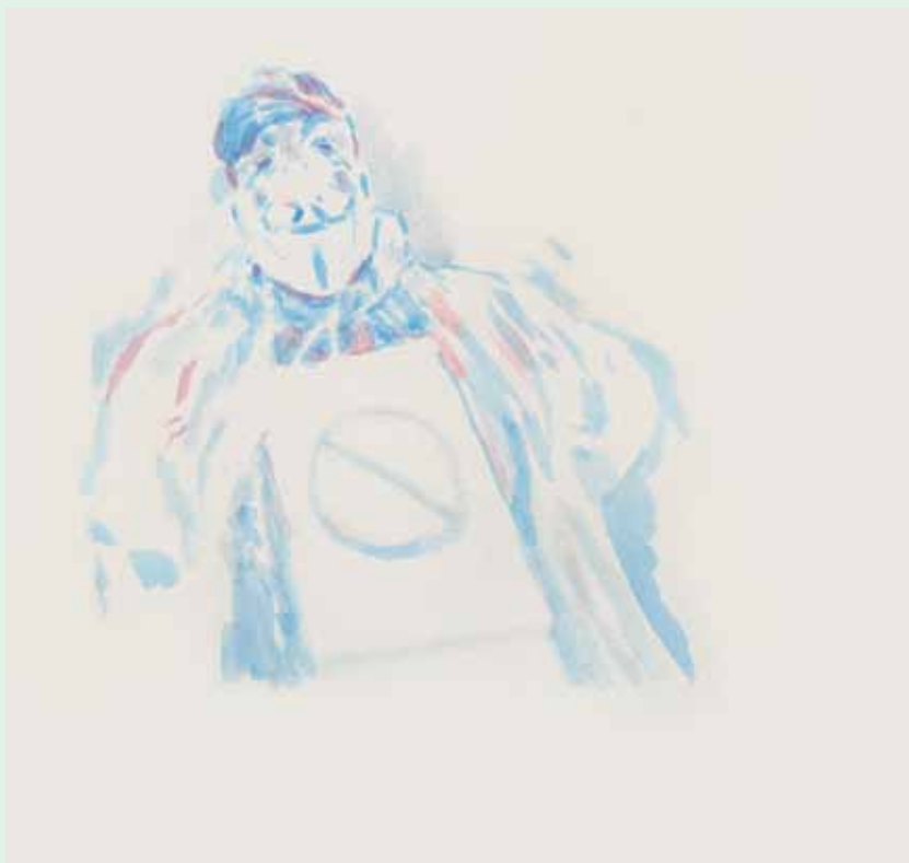
Protest, akril na papiru, 34x33cm

ii društvenih normi. Najviše me je dotakla potpuna marginalizacija pojedinaca i skupina koji su promjenu željeli postići (radnici Diokija, RIZ-a, LGBT-populacija).