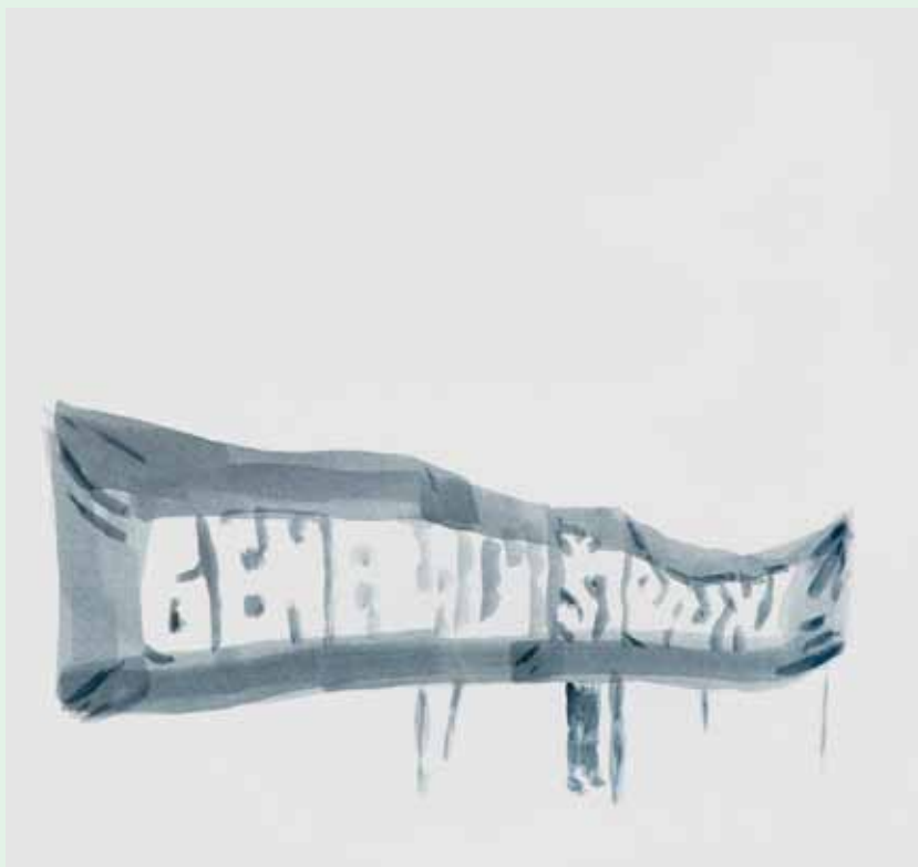
Protest, akril na papiru, 34x33cm

Nakon prosvjeda nastavio sam s praćenjem sličnih događanja i zaključio kako se u našoj zemlji ovakvim prosvjedima postiže premalo, dok u svijetu nerijetko rezultiraju čak i gubitkom određenih socijalnih prava