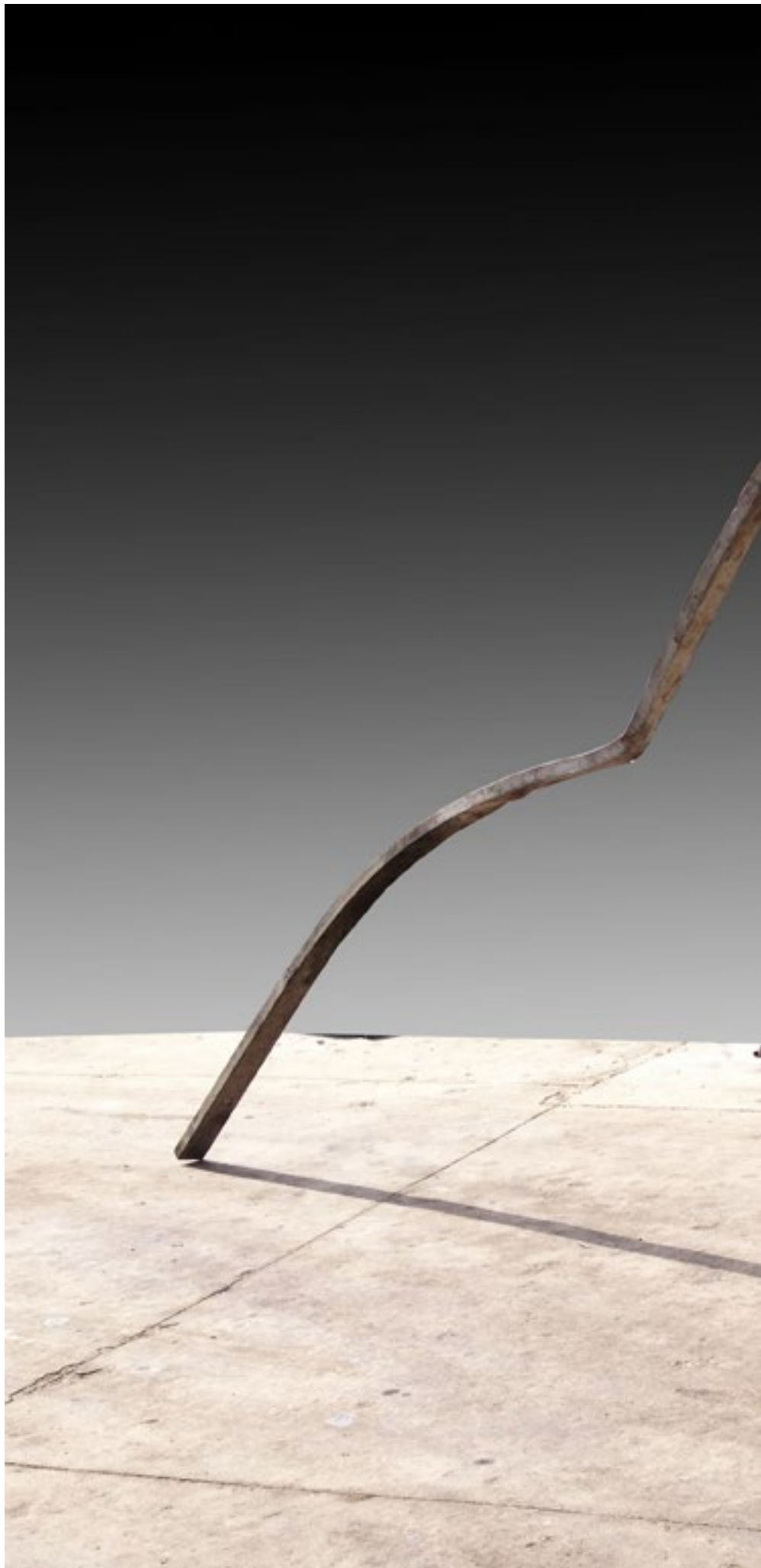
Poznato / Well known 210x380x140 cm