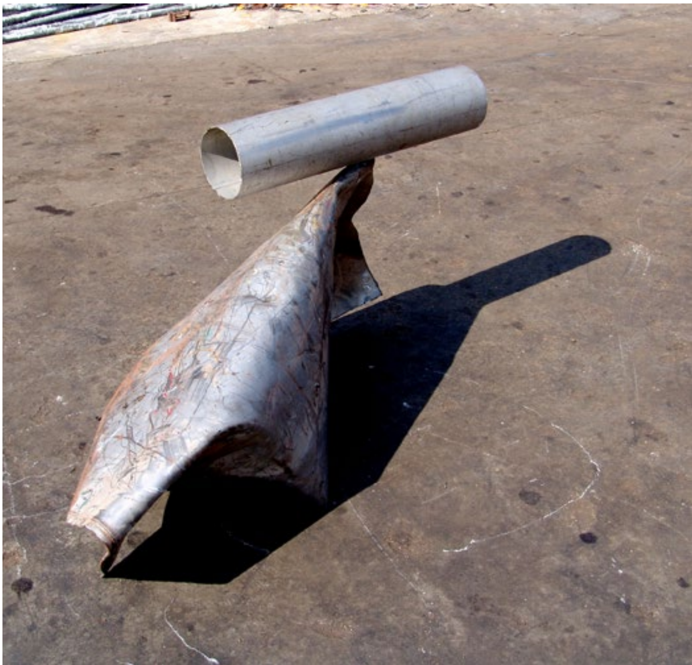
Arhitekt / Architect 210x380x140 cm