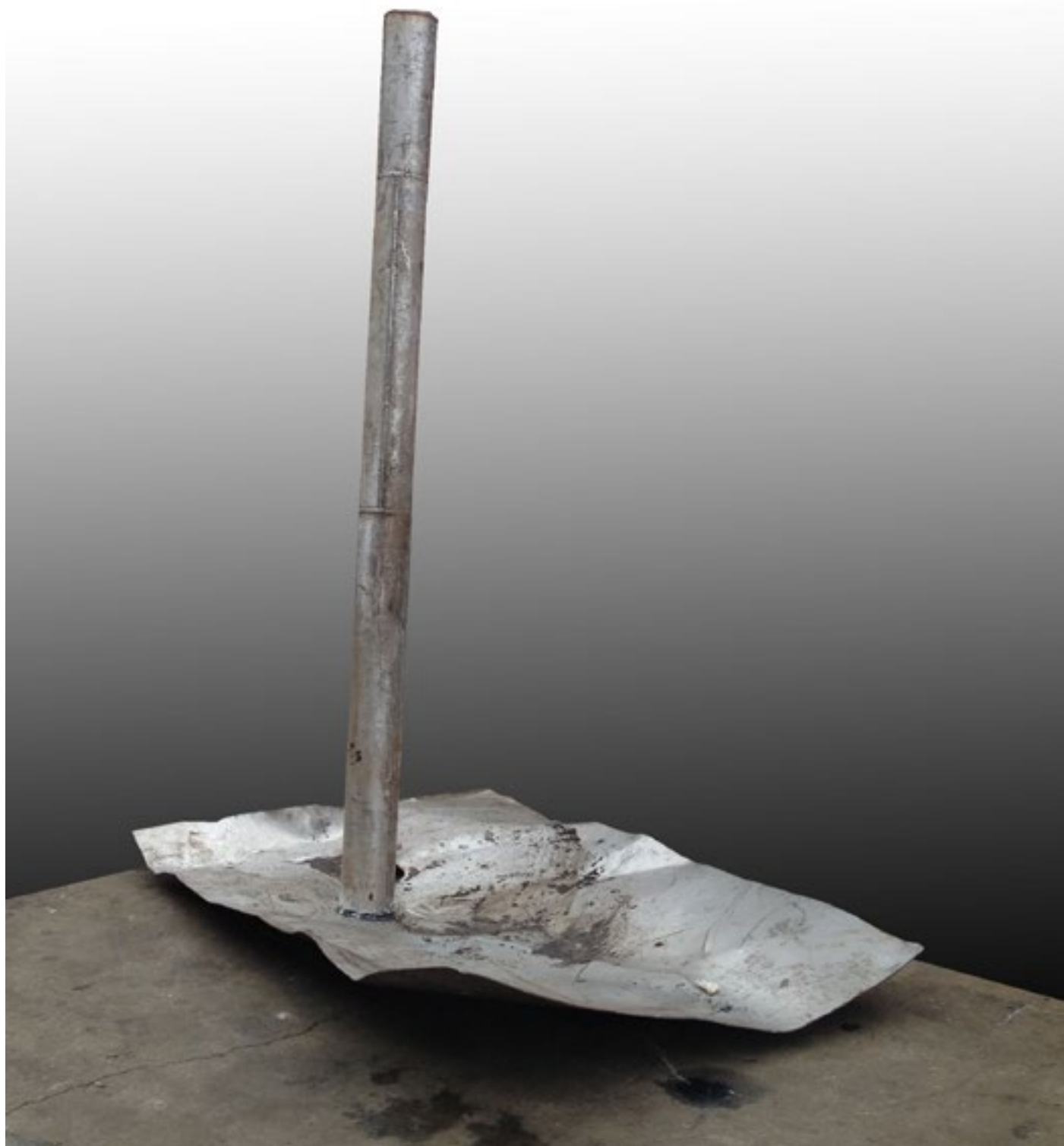
Španjolska / Spain 200x80x90 cm