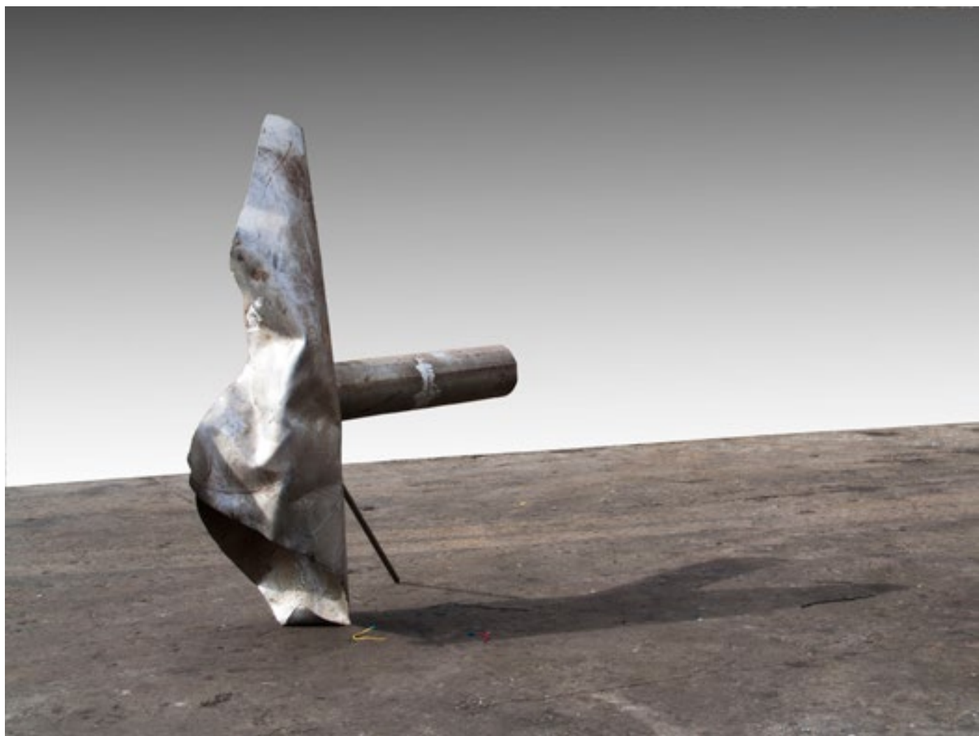
Procesija / Procession 170x160x70 cm