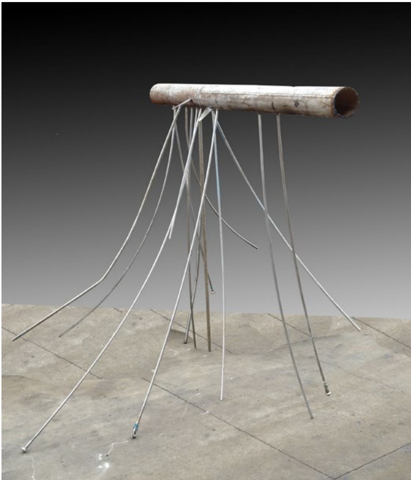
Nisam ga više slušala / I did not listened more