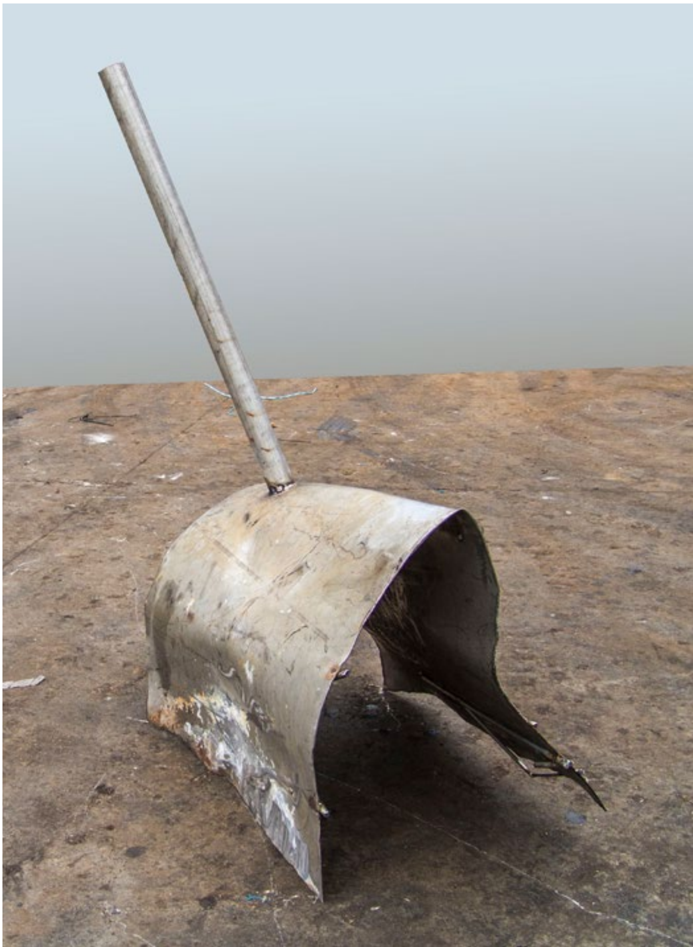
Tajanstveno / Misteriously