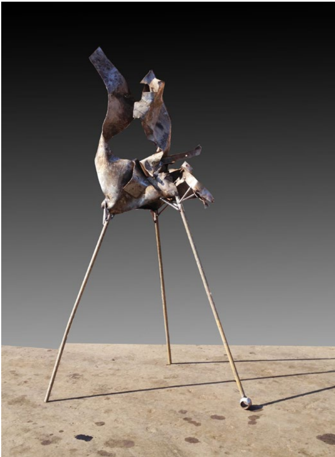
Nigdje ni cvijetića / Nowhere flowers