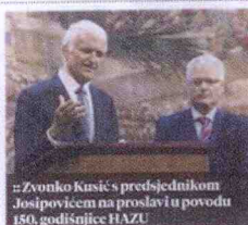
„Zvonko Kusić predsjednikom Josipovićem na proslavi u povodu 150. godišnjice HAZU

„Kako se HAZU nosi s aktualnom krizom u izdavaštvu? Jeste li ispunili svoje planove? Samo lani Akademija je izdala 114 svezaka raznih publikacija, još 65 izdala su drugi naučnici uz pomoć Akademijine Zaklade, a 21 knjigu napisali su sami akademici, tako da je zahvaljujući Akademiji lani objavljeno ukupno 200 naslova. Dakle, unatoč krizi uspjeli smo ispuniti svoj plan izdavačke djelatnosti koji je uostalom prilagođen okolnostima u kojima živimo. Čini se da će situacija ubuduće biti još teža. No neke publikacije naprosto moramo nastaviti izdavati, poput Foruma, časopisa Razreda za književnost koji izlazi od 1962., a da ne spominjem časopis Rad koji izlazi od 1867. ili Ljetopisa za svaku proteklu godinu koji izlazi od 1877. Među velika Akademijina izdanja ubraja se edicija Hrvatska i Europa koja multidisciplinarno obrađuje sve najbitnije događaje za hrvatsku povijest, društvo, znanost i umjetnost i u sklopu, a koja se izdaje na hrvatskom, engleskom i francuskom jeziku. Upravo traje uređivanje petog sveska, o Hrvatskoj i Europi nakon 1918. To je kapitalno djelo hrvatske kulture koje mnogo znači za promociju Hrvatske u svijetu, a u nas je slabo poznato.