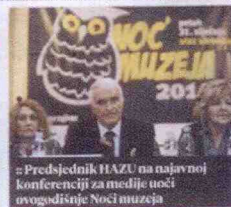
„Predsjednik HAZU na najavnoj konferenciji za medije uveći ovogodišnje Noći muzeja