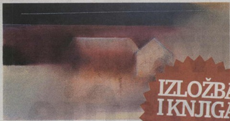
HRVATSKE KUĆE, 1991. PEJZAŽ IZLOŽEN U GALERIJU ADRIS AUTOPORTRET, 1954. NALAZI SE I NA KATALOGU IZLOŽBE