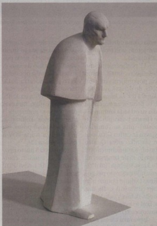
Nagrađeni rad spomenika papi Ivanu Pavlu II