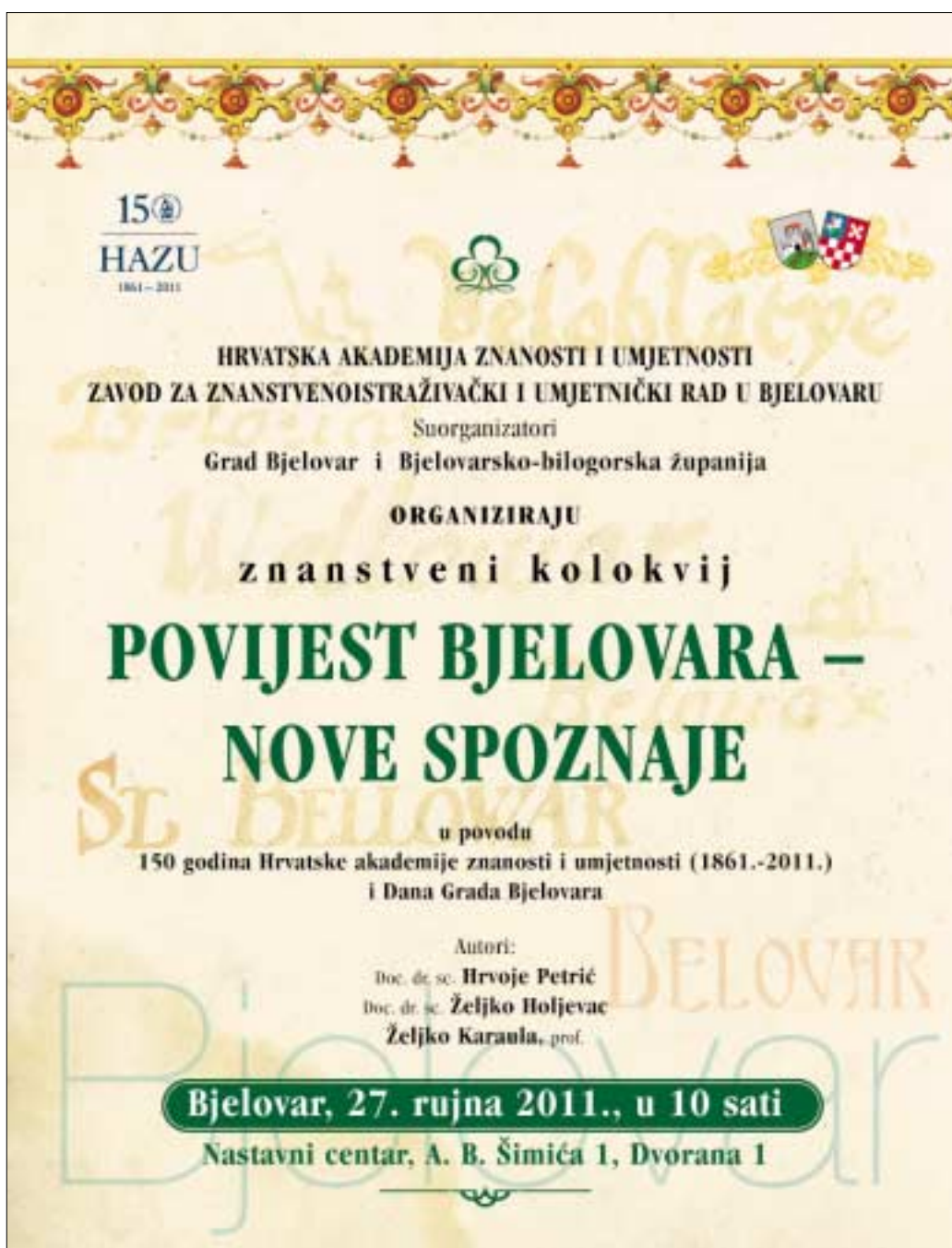
Plakat znanstvenog kolokvija

Znanstveni je kolokvij održan u povodu 150 godina Hrvatske akademije znanosti i umjetnosti i obilježavanja Dana Grada Bjelovara.