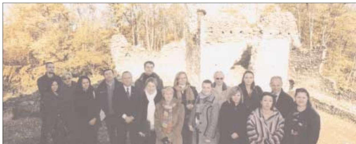
Sudionici znanstveno-stručnog skupa na Garić-gradu