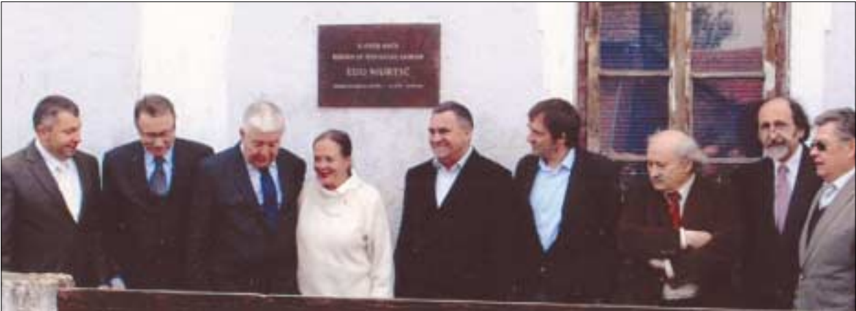
Otkrivanje spomen-ploče Edi Murtiću u Velikoj Pisanici

U planovima rada Zavoda je i pripremanje izložbi. Tako je 2008. organizirao zajedno s Gradskim muzejom Bjelovar izložbu Hrvatska akademija znanosti i umjetnosti kroz fotografiju , a 2010. Edo Murtić – povratak u zavičaj u Velikoj Pisanici, rodnom mjestu akademika Murtića. U sklopu projekta Dani Ede Murtića koji se ostvaruje u Velikoj Pisanici, rodnom mjestu akademika Murtića, pripremljena je izložba akademika Zlatka Kesera od 5. do 20. svibnja 2011., a spomen-ploča na rodnoj kući akademika Murtića postavljena je 5. svibnja 2011.