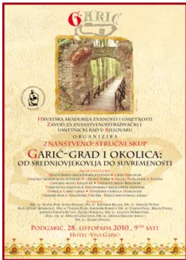
Plakat znanstveno-stručnog skupa

Ivan Paližna u povijesnim vrelima i historiografiji