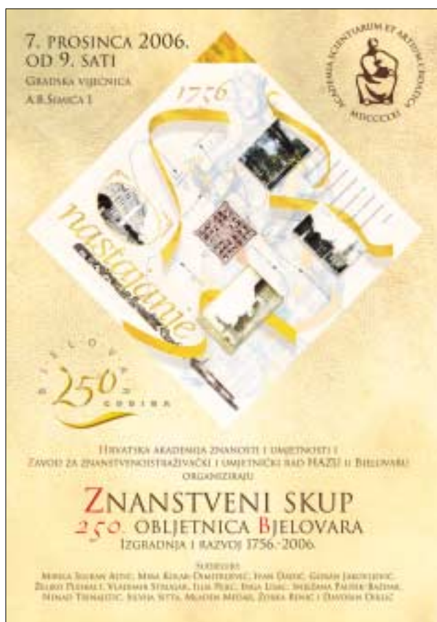
Plakat prvog znanstvenog skupa