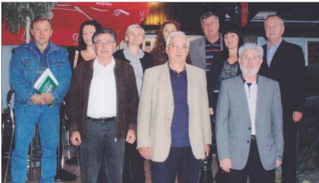
Članovi Znanstvenog vijeća i Organizacijski odbor skupa o Garić-gradu (2010.)