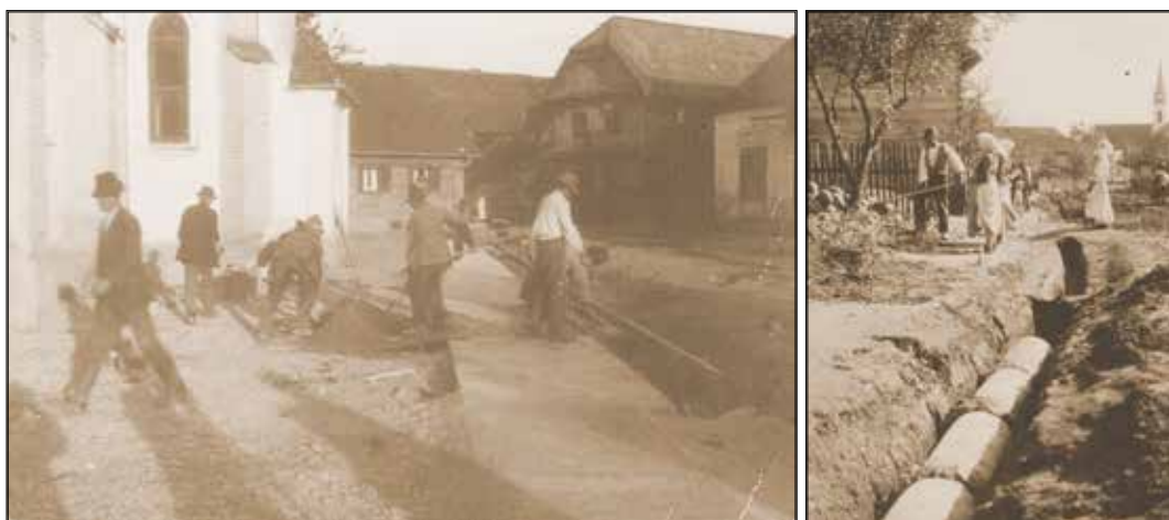
SLIKA 9. Izgradnja pločnika i odvodnog kanala u Mraclinu (oko 1928. godine)

Sresko poglarstvo u Velikoj Gorici broj 3447 od 2. travnja 1928. godine donijelo je odluku koliko metara zemljišnog prostora pojedino kućanstvo treba besplat-