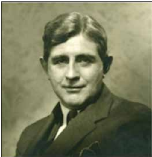
SLIKA 11. Selskar M. Gunn bio je glavni izaslanik Rockefellerove fondacije za Europu u vrijeme asanacije Mraclina

posjetili selo Mraclin. Gunn je bio oduševljen radom na asanaciji te svime onime što je bilo vezano za javnozdrav-