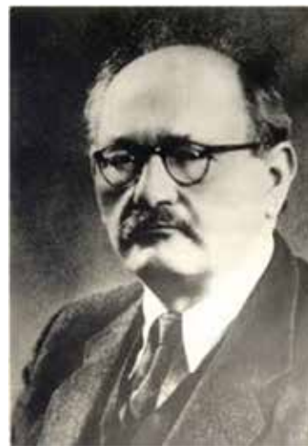
SLIKA 2. Andrija Štampar (1888.– 1958.)

u području javnoga zdravstva u Kraljevini SHS, odnosno Kraljevini Jugoslaviji. Osnovao je, pokrenuo, supokrenuo ili imao bitnoga udjela u utemeljenju dvjesto pedeset higijenskih ustanova, po-