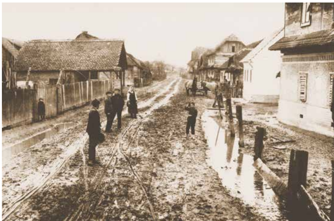
SLIKA 1. Mraclin prije asanacije

ka), s oko 180 kuća, crkvom i školom, s velikom barom usred sela, uz nekoliko manjih, neuređenih za kišnih dana blatnih ulica, s plitkim otvorenim zdencima smještenim u dvorištima nedaleko kuće, neograđenih gnojnica, svinjcima i stajama. Dominantne su bile crijevne bolesti i tuberkuloza. 2 (slika 1).