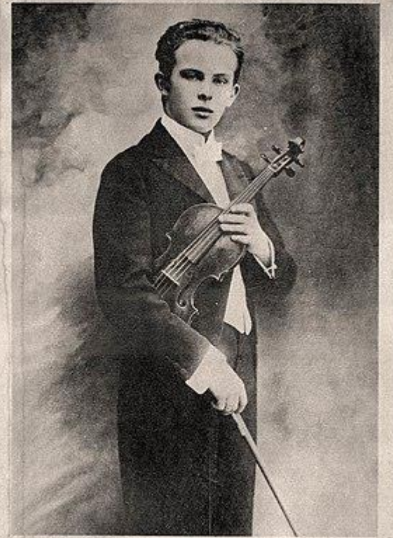
VASA PRIHODA GREAT BOHEMIAN VIOLINIST